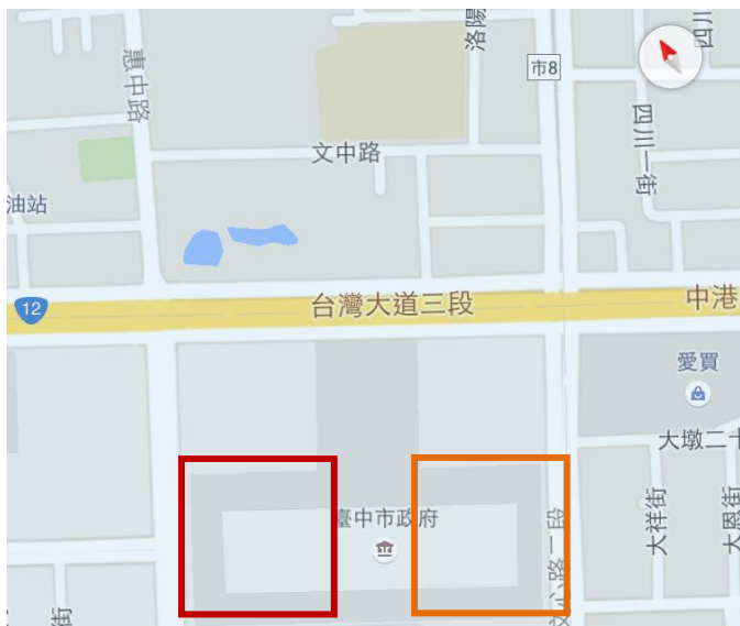
臺灣大道市政大樓 地圖示意

紅色方塊為惠中樓(A棟) 橘色方塊為文心樓(B棟) 畫面右邊為往火車站方向 畫面左邊為往國道1號方向