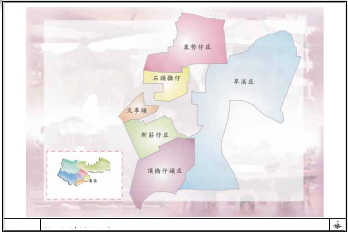
圖附 2-2-1 台中市東區清代地名位置圖