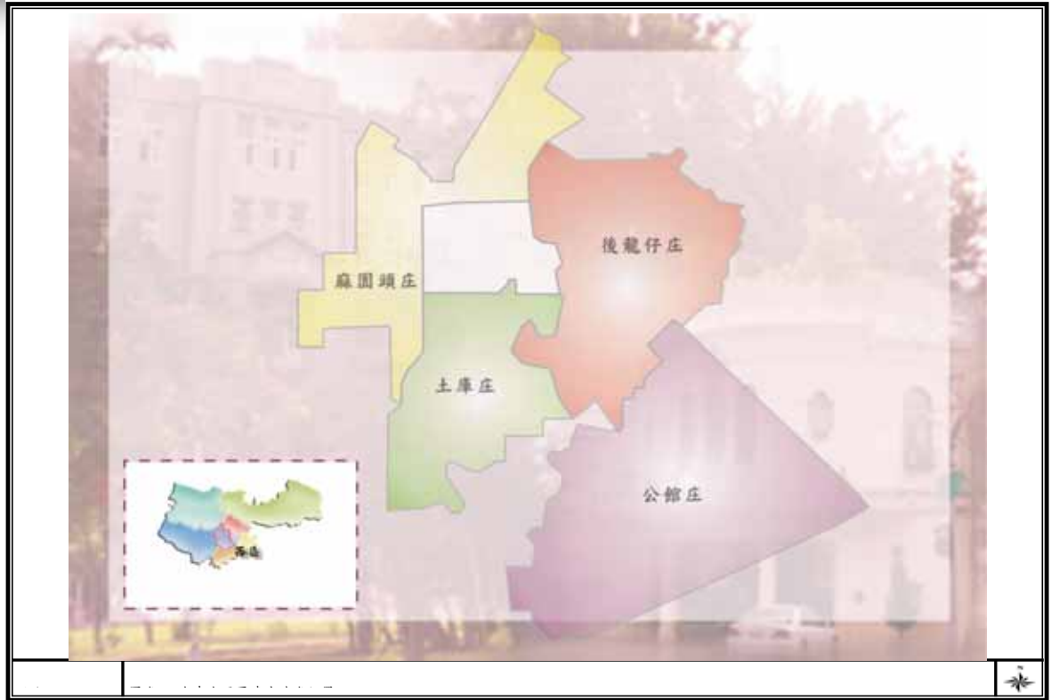
圖 附 2-3-1 台中市西區清代地名位置圖