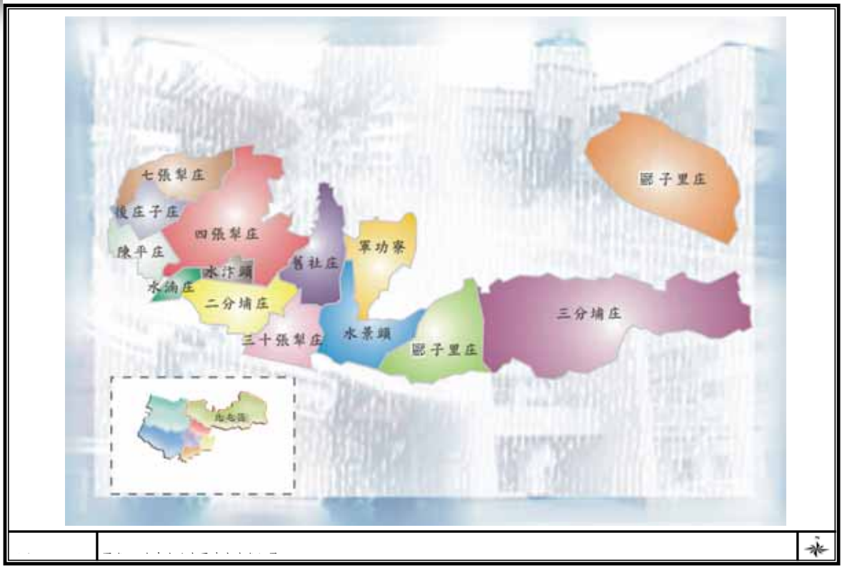
圖附 2-6-1 台中市北屯區清代地名位置圖