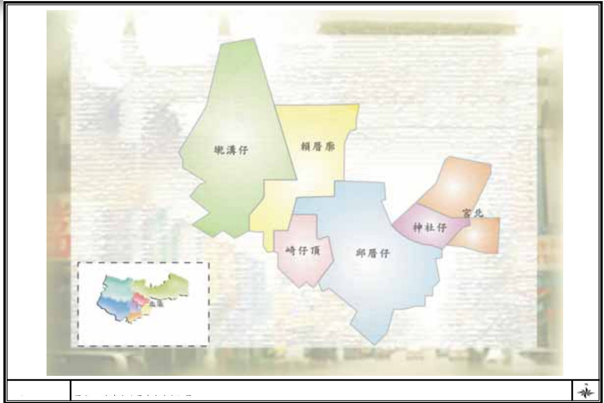
圖附 2-5-1 台中市北區清代地名位置圖