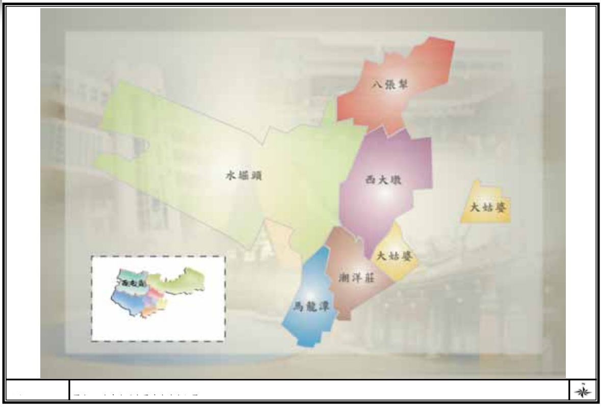
圖附 2-7-1 台中市西屯區清代地名位置圖