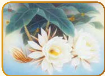
經典瑰寶名家邀請展

除了上述活動，館慶期間還有系列展覽、講座、南管戲曲、音樂會、文創市集，以及影片欣賞、親子說故事、FB 線上精采活動，歡迎市民一同歡度大墩文化中心 40 周年生日慶，並持續和大墩攜手譜寫下一個美好年代。