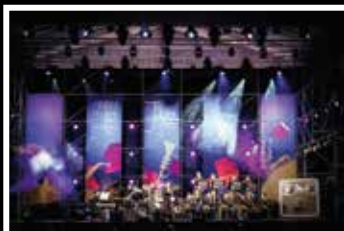
臺中青少年回娘家爵士樂團