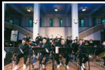
踢霹歐爵士大樂團