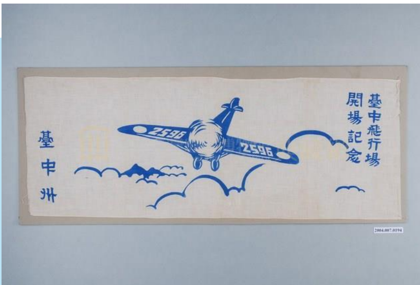
臺中州臺中飛行場開場紀念布旗

你知道嗎？每一天你所抬頭凝望的這片天空，她的今與昔存在著多少精采的過往。我們臺灣的天空，曾飛行過許多訪客們：太陽旗軍機、塗蓋青天白日國徽的蘇聯紅旗軍機以及星條旗軍機。這些離我們遠去的事物，如今靜靜的在天空裡，剩下雲朵陪伴她。