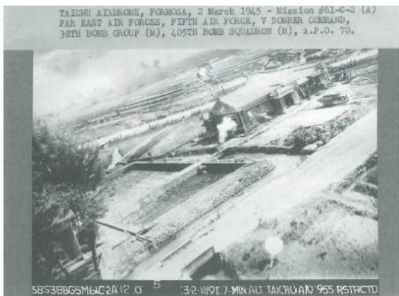
1945年3月 美軍第405轟炸中隊臺中飛行場，可看到一架偽裝的飛機