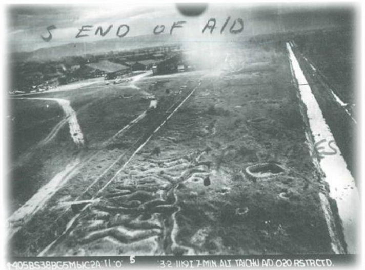
被空襲中的臺中飛行場，可從照片觀察到壕溝與地洞

美軍的轟炸機會裝置相機鏡頭在機翼或機尾，目的是評估空襲成果。這種軍事用途卻意外保存許多當時空拍的影像，留下許多城鎮、地景照片。從美軍飛機的眼睛，我們可看到一些臺中飛行場的珍稀照片。