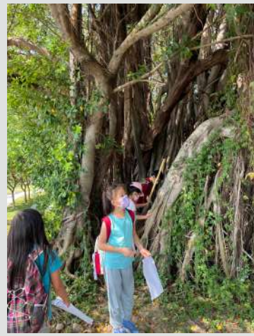
探索中央公園與老樹公園

尚武的社會氣氛，從嚴格徵選中脫穎而出，為國家奮戰，是非常光榮的事，他也只能配合接受。1943年，搭上運輸艦，陳千武從高雄港出發，前往印尼，正式投入戰爭。