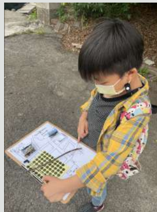
探索途中與探索機艙堡

〈指甲〉 / 陳千武 指甲長了 最近 指甲長得特別快 看看指甲 我底指甲替我死過好幾次 每次剪指甲 我就追憶一次死..... ——把剪下來的指甲裝入信封 繳給人事官准尉 在戰地 粉骨碎身 拾不到屍體 就當骨灰用 那個時候 我當日本兵長—— 不管我的意志是快樂或悲傷 不久 指甲總會長 長到 我感覺不舒服的時候 指甲很乖地 又讓我剪 指甲好像是我底生命之外的 生物 長了就要我剪 每次剪下來的指甲 都活著 然後 慢慢地 替我死去