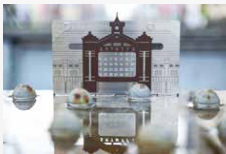
▲台華精技 萬年曆—台中車站款

深耕台中 20 年的鈹金加工製造商台華精技，將鈹金加工技術融合現代設計，呈現出生活美學。今年獲選創意生活類的「萬年曆—台中車站款」，以台中車站和鐵路為設計發想，將建築順著軌跡對應在日期上，沒有年份限制，可自由移動，還可根據使用者習慣彎曲閱讀角度。將平淡無奇的鈹金變身為生活用品，正是創意生活的好例子！