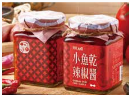
▲德普食品阿妮 ANI 辣椒醬系列

德普食品推出的「阿妮 ANI 辣椒醬系列」，是創辦人為印尼籍夥伴所打造的私房醬料品牌，包裝設計取自於印尼傳統蠟染技術 Batik，並選用印尼新人的最愛 truntum 圖騰與台灣傳統瓷磚做結合，鮮豔紅色傳達出台中對新移民的友善與熱情。