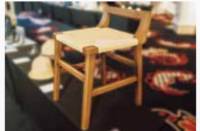
▲好倫家 青原紙織椅

好倫家為台中四十年木器工廠接班人，將傳統工藝注入設計能量，成立家具品牌 COMMON。獲選工藝品類認證的「青原紙織椅」，坐面採十字編織法，椅背口型設計，不僅支撐腰部也方便單手提起，乘坐時更可以感受繩編承受壓力時的回應，微微交互摩擦的聲音，彷彿在歡迎您的到來。