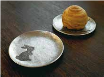
▲ JIAJ 節慶意象錫皿

加作 JIAJ 是專門製作金屬工藝物件的工作室，以雙手打造生活中與情感連結的器物，承習台灣傳統製錫技法，結合現代思維，將傳統工藝精神與技法的美感融入生活體驗。本屆獲選工藝品類認證的「節慶意象錫皿」，以設計簡潔的圓形淺皿外觀，搭配金工工藝與手工鑿花技法，鑿出富節慶意涵的現代圖案，利用鑿花深淺與染色，表現圖案的生動與趣味性。