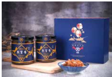
▲丸文食品 花都嘉年華禮盒

視覺及包裝設計類也相當精采。丸文食品為 1950 年在台中第一市場起家的老字號魚漿煉製品商家，本次獲選產品「花都嘉年華禮盒」外觀顏色選用丸文職人藍，簡約大方的設計與整體色澤呈現一致，帶給消費者清晰的產品印象。