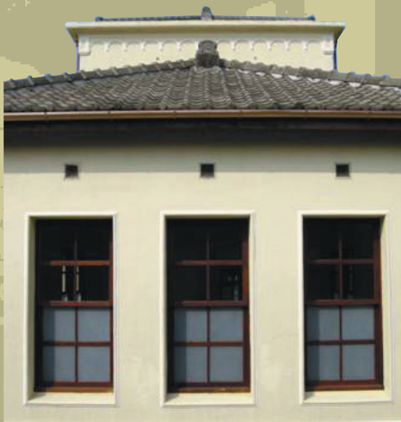
前棟屋瓦以原水泥瓦回鋪

昭和三年（西元1928）十一月十日昭和天皇的登基大典時，因為此時在台的日人十分希望能同時聽到實況轉播，給予當時日本政府極大的壓力，因此在今總統府後面的交通部設置電力千瓦（KW）的「台北放送局」，並從11月起開始進行實驗廣播，成為台灣島上廣播的濫觴。之後為了改善中南部因地勢阻隔所造成之收聽品質不佳，因此台中放送局於地方人士熱切期望下而設置，並於昭和十年（西元1935年）五月十一日啓用。台灣放送局的任務，除了作為日本政府對於台灣本島政治性的社會教化工具外，昭和十七年（西元1941年）太平洋戰爭爆發後，台北放送局更成為對於日本其他殖民國政治宣傳的轉繼站，定時的以北京語、廣東語、英語、馬來語、印度語，