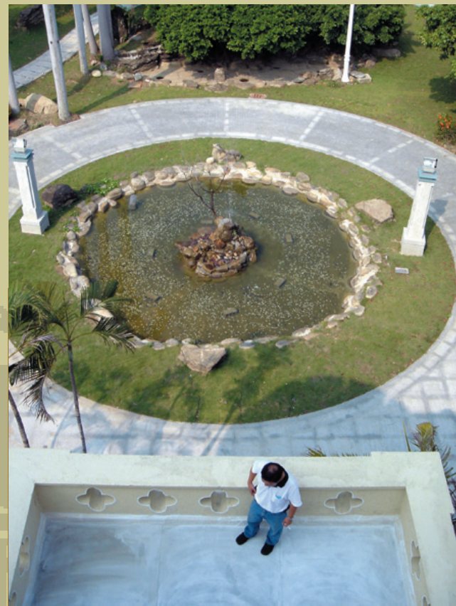
具巴洛克風格的圓形水池