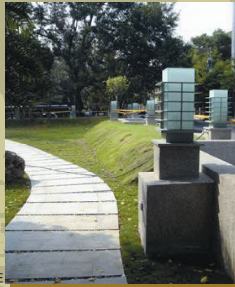
周邊以矮牆及土丘取代圍牆，增加可及性

修復工程自民國92年9月開始進行，於民國93年8月修復完成，此次工程包含建築本體修復及庭園景觀。建築物本體的修復以創建時之形貌為修復依據，盡量保留原有且堪用之建築構件，而對於需要重新製作的部分儘可能以原有或相近材料，並以傳統施工方法依原有樣貌進行仿作修復。