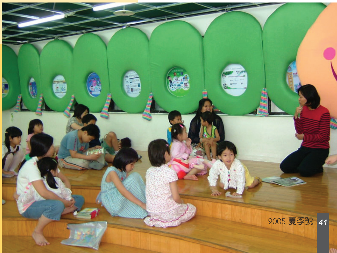
小朋友沉浸在毛毛蟲變成美麗蝴蝶的閱讀情境中

文化局希望營造的是一個「身歷其境」的「聽故事」時間，也希望，這種利用角色扮演的閱讀方式，可以引發小朋友與家長對閱讀的參與，進而聯結圖書館利用智能，培養兒童利用圖書館資源的習慣與能力，而成就一個孩子獨立學習的能力。❖