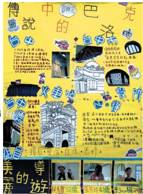
小朋友文化探索之旅可愛的作品

驚慌與不知所措。不知趕路的旅客是否曾經駐足欣賞？那寬廣的門廳，挑高的天花板及紅白相間的山牆，原來台中也是這麼的古典與美麗啊。