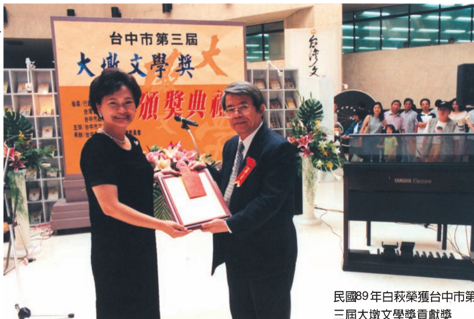
民國89年白萩榮獲台中市第三屆大墩文學獎貢獻獎

18歲就獲得中國文藝協會第一屆新詩獎，被稱頌為「天才詩人」的白萩，曾自喻如雁一般的浸淫在詩的天空中，不斷地向追求的目標前進！