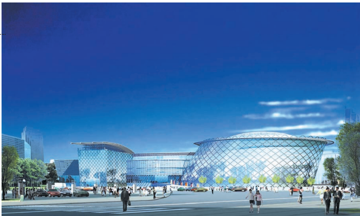
國立台中圖書館未來新面貌，預計將於民國97年為中部民衆提供最佳服務

國立台中圖書館的前身為日據時期的臺中州立圖書館。在清朝時期，由日人發起了籌設圖書館的構想，卻因經費及諸多原因未獲解決而中止。