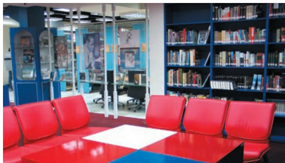
「美國資料中心」提供民眾查詢美國相關資訊的功能

圖書館預計95年3月完成廁所改建、中興堂圍牆及前庭改建工程，而館方亦計畫在五權南路、建成路口，興建一座現代化的圖書館已列入政府新十大建設計畫—「全國文化學習資源中心興建計畫」遷館大計，這些都是為了要提供市民更新穎、設備更完善的資訊空間。我們期待它的早日完工，也盼大家能多多利用、善用這座多元豐富的知識寶庫！❖