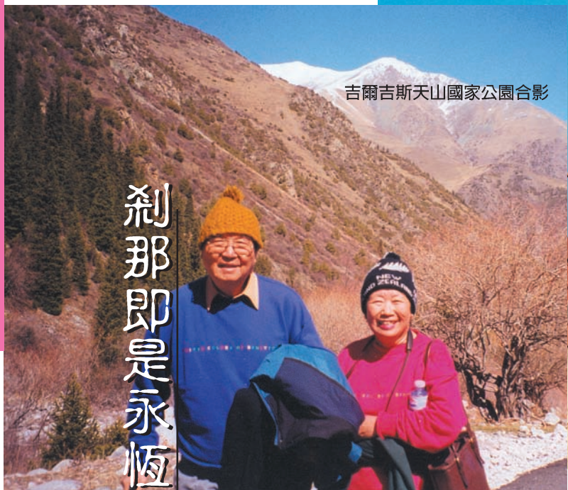
吉爾吉斯天山國家公園合影