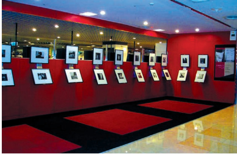
攝影走廊精彩作品展出

數的觀眾席。每個月配合不同節慶季節有著不同的主題，細數今年在此舉辦過的活動，場場人數爆滿，主題多元化新鮮又好玩。例如6月中旬與台中市放送局合辦的「聽聲音·看歷史」，現場還展出百年留聲機，讓現場大小朋友彷彿置身歷史迴廊；「沙發電影院」將6月訂為旅遊月，現場播放如「西雅圖夜未眠」等多部結合旅遊這個主題的電影，觀眾躺在舒適的沙發座椅上，欣賞著大螢幕絕佳音響效果，專業水準比起電影院可是有過之而無不及呢！10月份與法國在台協會合辦「冒險閱讀樂」，鼓勵父母陪著小孩一起閱讀，活動現場書香四溢；親子活動也有與「雲門舞集」合辦過動態的「肢體律動」，不但教你動動腦，也要教你扭扭腰擺擺臀。參與現場活動，你會覺得時時刻刻都像在吸收人文與科技的芬多精一般，使文學、音樂、科技直接與民眾生活結合，享受豐富的心靈與精神活動。另外，現場也提供年代、兩廳院售票系統服務，這更是Fnac法雅客堅持一定要有的元素。