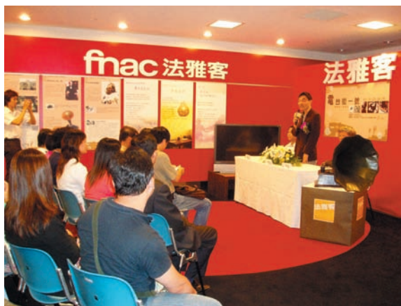
放送局特展記者會

帶動文化與新科技複合式消費風潮的Fnac法雅客，有別於一般的賣場，不但有各領域專業的服務人員，實際貼近消費者的需求，打造消費者心中最佳的購物天堂，法雅客更認為賣場不該只是一個販賣商品的地方，而應該是「文化的、數位的、新知的人文空間」。由於堅持著「文化、新科技、創新、消費者主義」的理念，雖然法雅客進駐台中才短短兩年的時間，卻在這麼短時間內讓數位時代的科技產品與消費者更貼近，以科技結合文化媒體的藝文表現更大大提昇消費者在精神層次的滿足，讓民眾有更多機會親近多元化的文化--走一趟Fnac法雅客，進行一場心靈SPA！❖