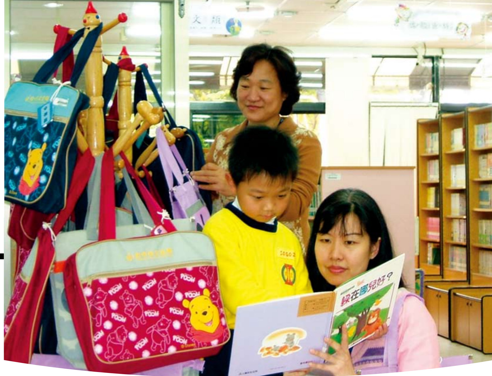
「書香套餐」一次滿足孩子精神糧食

然而，文化局並不以此為滿足，繼這項方便市民還書措施後，再度推出全國首創的「借書得來速」服務。您一定知道麥當勞有得來速，免下車輕鬆又快買，但是，您知道圖書館也有得來速嗎？只要5分鐘，以快速套餐帶著走，一次滿足孩子精神糧食的需求，解決現代因工作