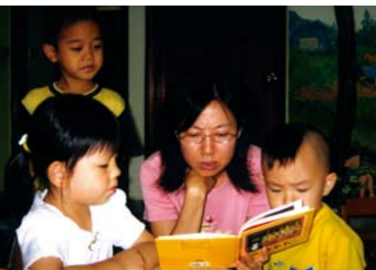
親子共讀同享閱讀樂趣

常有人問小大的義工媽媽：是什樣的動力能支持妳們經營繪本館？除了我們都喜歡繪本、熱愛閱讀外，每次在館中見到一對對共讀的親子，沉浸在繪本的樂趣裡，這幅幸福的景象是人世間最美的風景，也是我們繼續堅持守護這座繪本花園的力氣。