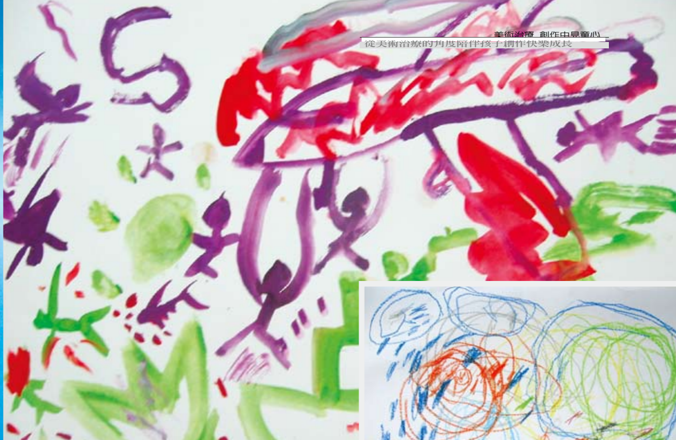
美術治療 創作中見童心 從美術治療的角度陪伴孩子創作快樂成長

7歲男生利用老師為他準備的麵團所做的刺蝟，那是他所喜歡的動物。麵團不會弄髒手，比紙黏土更有彈性，表現的方式也不太一樣。