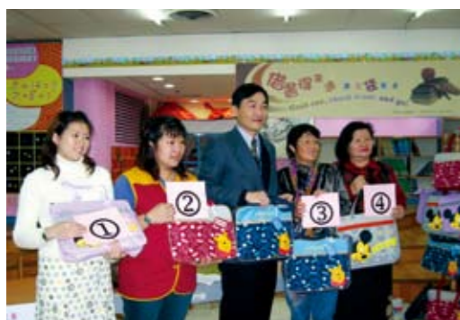
書香套餐「袋」著走，方便又迅速。(上圖) 依照不同年齡層兒童所設計的書香套餐(下圖)

「一個城市的文化風貌，表現在市民生活方式的內涵上，台中市若要展現文化魅力，需從閱讀開始做起」。