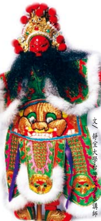
文／靜宜大學台灣史文學系講師 林茂賢

布袋戲是偶戲中流傳最為普遍的劇種，目前臺灣各地還有不少野臺布袋戲班，在臺中布袋戲劇團有「五洲園今日」、「大台灣」、「小西湖」、「源世界」、「春秋閣」、「永興閣」等表演團隊。傳說布袋戲約產生於十七世紀。其來源說法不一，文獻上記載，可能從傀儡戲演化而來，「耍傀儡子：一人挑擔鳴鑼，前囊後籠，耍時以扁杖支起前囊，上有木雕小臺閣，下垂其籃布圍，人籠皆在其中。」另有人據此認為布袋戲之原始形式，可能源自大江南北流浪的「肩擔戲」。