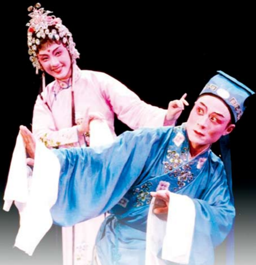
梨園戲的小生和小旦，藉由眼神與肢體動作，一擺頭、一甩手，展現出劇中人物的感情與心情。

括南管戲、九甲戲、亂彈戲、四平戲、歌仔戲、客家戲，以及大陸京戲、豫劇等大陸劇種；小戲包括車鼓弄、牛犁陣、桃花過渡、三腳採茶戲等；偶戲包括布袋戲、皮影戲及傀儡戲。