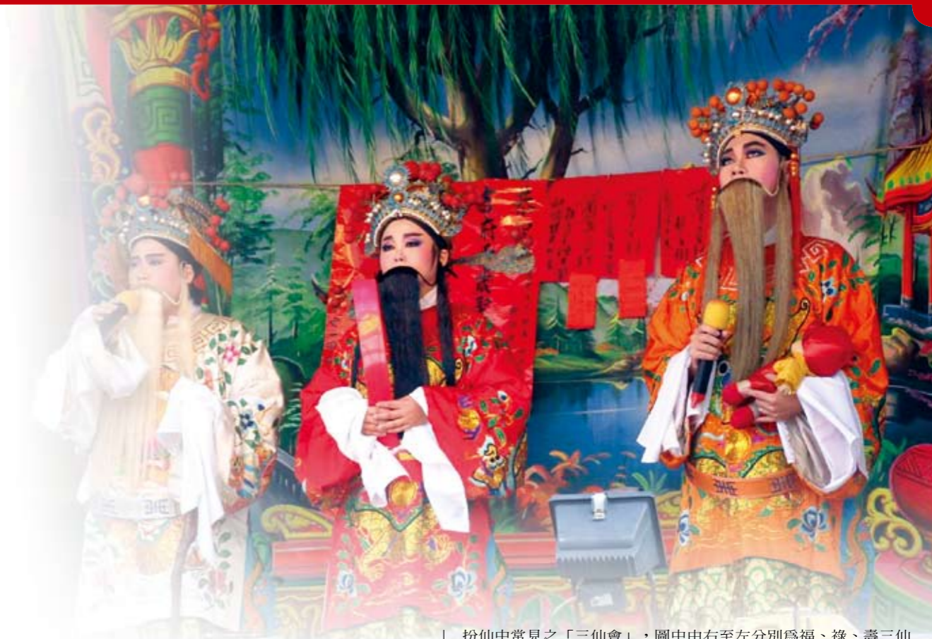
扮仙中常見之「三仙會」，圖中由右至左分別為福、祿、壽三仙演出：台中小金枝歌劇團