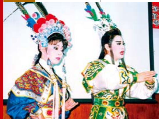
校園推廣——秀琴歌劇團。

每一種演出型態皆讓歌仔戲注入新生命，使歌仔戲更能符合時代脈動，配合社會潮流。在歌仔戲發展過程中，不斷吸收各種民間藝術精華，融合各劇種音樂、身段、舞臺技術，成為最具臺灣人文特色的本土劇種。歌仔戲對臺灣人而言不祇是一種表演藝術，更兼具宗教信仰、休閒娛樂、社區聯誼、國民教育、撫慰人心等多重社會功能。臺中在地的歌仔戲演藝團隊有「拱樂社」、「小金枝歌劇團」、「國光歌劇團」、「五虎歌劇團」、「連興歌劇團」、「秀琴歌劇團」、「玉興歌劇團」等。■