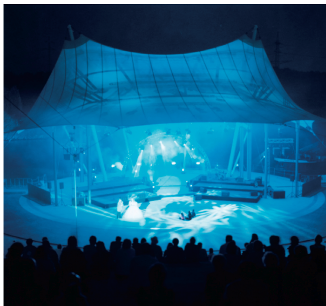
左圖/ 酒神劇場戲劇演出模擬圖 上圖/ 現在的酒神劇場演出盛況