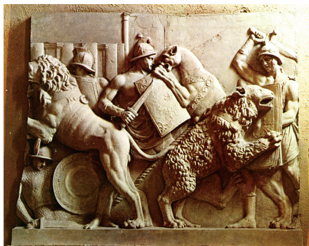
上圖/ 格鬥士表演與野獸搏鬥浮雕。