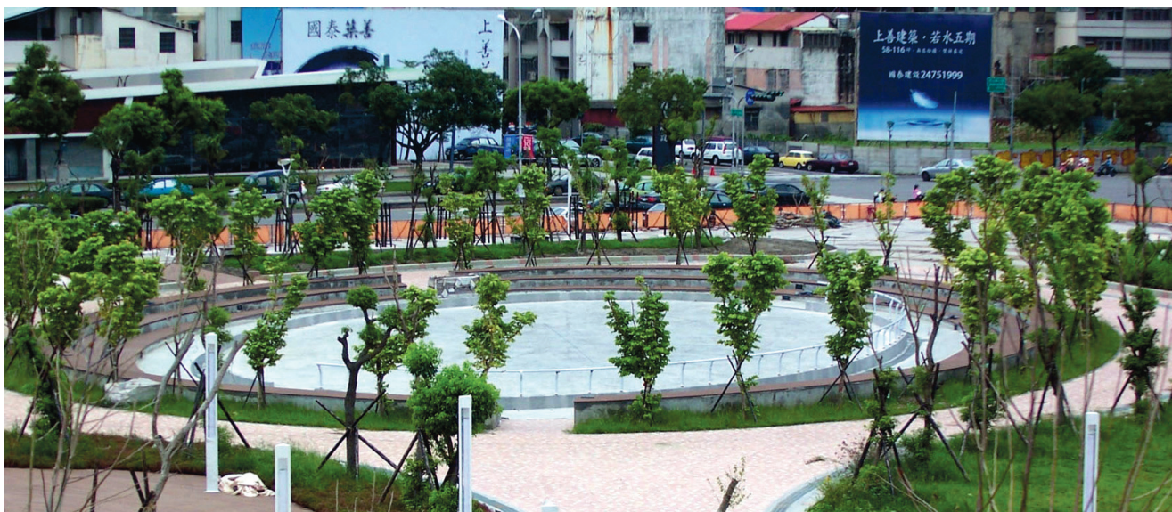
戶外圓形劇場中，提供民眾休閒運動的環型溜冰場。

散，偶而微風輕拂更添舒涼；儘管是寒峭冬天，只要人群聚合，表演開場，便覺暖意暗生，綿延至表演散場。台中很適合戶外演出，觀賞者、表演者一同享受綠地與表演藝術結合慵懶閒適。