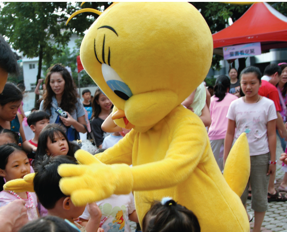
| 超級卡通明星崔弟與民衆相見歡。