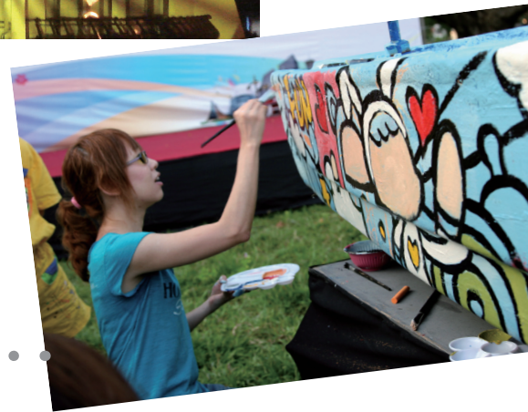
| 右圖/專業插畫師為台中公園的游湖船增添新裝。

速的科技時代，科技在人類生活中扮演越來越重要的角色時，對人文藝術的影響也將與日俱增，不管題材、媒材、表現手法，都影響著今日藝術創作的思維，因此在今年強調「藝術生活化 生活藝術化」的彩繪城市藝術節活動中，精心規劃了一場「藝術上身～湖心亭換新裝」活動，藉由高科技的投影技術，為湖心亭換上新裝，讓這座古典優雅的台中市地標，呈現出截然不同的風貌；除此之外當天下午邀請到了台中市的大家長胡志強、文化局長及知名插畫藝術家～22號兔替日月湖裡面的船彩上新裝，為台中公園增添藝術美感，下次到台中公園記得指定坐胡市