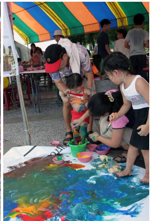
| 彩繪活動增進親子情感。

當代藝術家一胡朝聖先生，與台中市民開啓藝術的寶盒，解碼時尚透視藝術之時尚藝術講座；也邀請到了台灣塗鴉之父一呂學淵先生現場即興創作，以不打草稿的方式，在面寬500公分高300公分的畫布上直接上色作畫，令現場許多民衆驚艷塗鴉藝術的魅力，而當天也有不少喜愛街頭塗鴉的粉絲到現場觀摩學習！