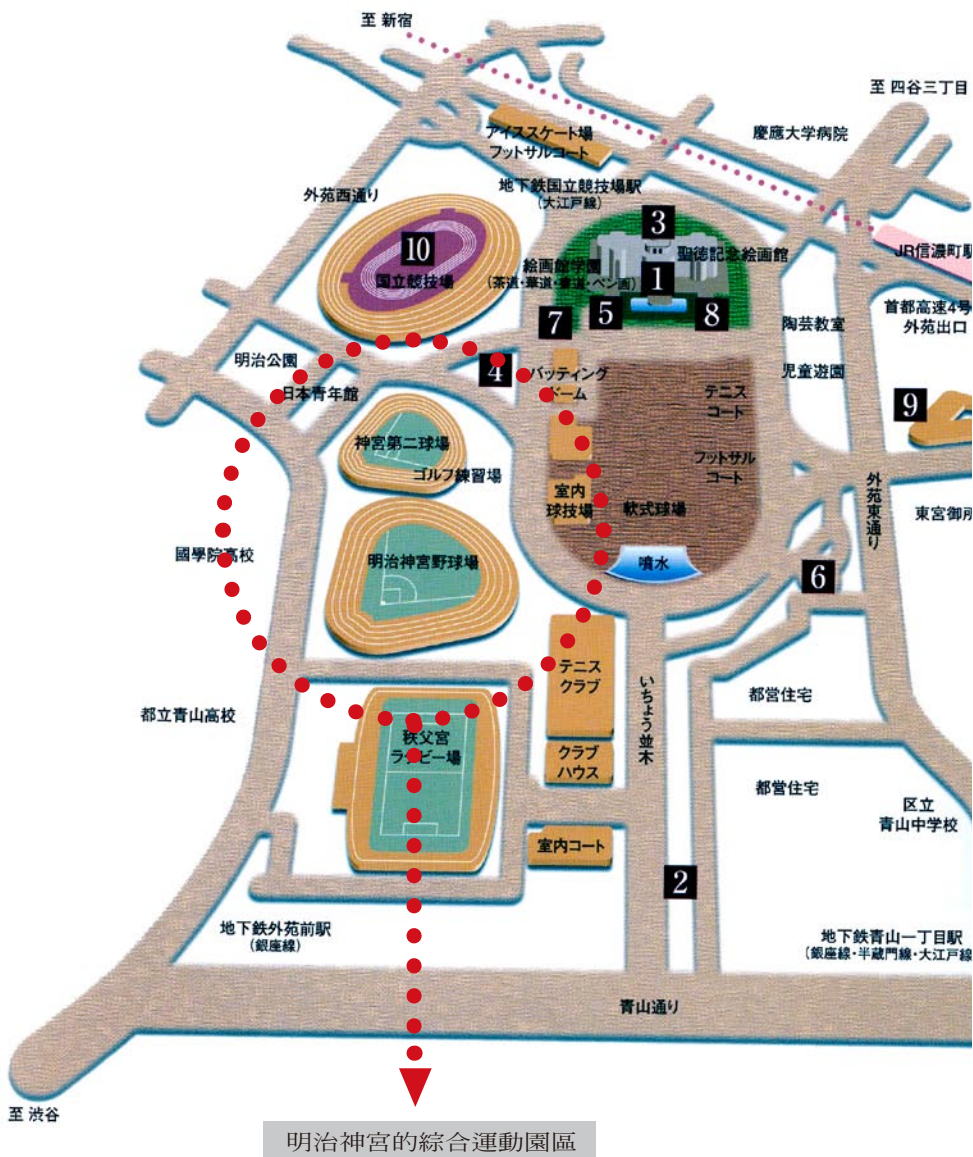
明治神宮的綜合運動園區