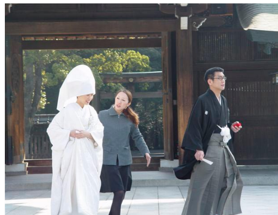
· 上圖/ 明治神宮古式婚禮極受年輕人歡迎，每年超過1300對的新人在此喜結良緣。

這次台中市政府日本行主要目的在於邀請王貞治代言世界盃，明治神宮的綜合運動園區經營則是考察的重點之一。這個總面積接近100萬平方米的空間，八十年來蘊育出眾多日本近世紀體育、休閒、文化藝術的人才，近年更是日本各種現代流行次文化的重鎮。假日這個區域充滿了運動競技、休閒、街頭藝人、流行活動，已