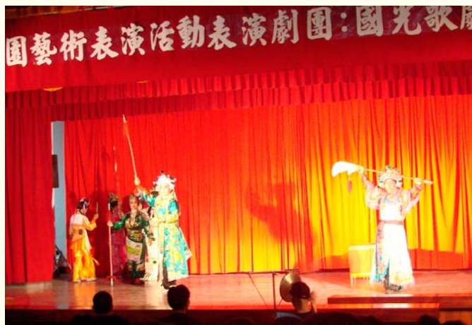
· 國光歌劇團演出才子佳人鳳凰情

本系列活動邀請國光歌劇團、小金枝歌劇團、聞韶軒絲竹室內樂團、風華樂集室內樂團、台中市踢踏舞蹈團、大樹下木笛樂團、大中青少年國樂團、音樂盒室內樂團、大開劇團、小青蛙劇團、藍天空劇團、五洲園掌中劇團、今日掌中劇團、隆義閣掌中劇團、台灣絲竹室內樂團及台中市交響樂團等本市立案表演團體演出。活動主題以多元化及通俗性表演為主，以生動活潑的藝術表演，搭配多元發展的中西樂器、戲劇、傳統戲曲及舞蹈介紹，藉由融洽的互動欣賞與學習，培養藝術欣賞基礎能力，獲得師生及家長熱烈的迴響。