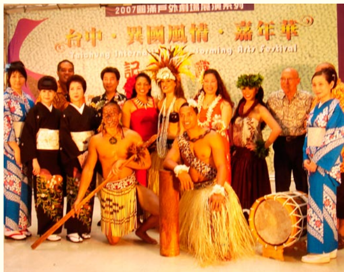
· 國外表演團隊出席活動記者會宣傳

連續 三天異國風華呈現，場場讓民眾體驗不同藝術多元樣貌，透過參與達到學習與享受文化盛宴。精采的活動也讓老天爺都心動，在時而晴天，時而細