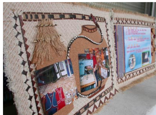
· 市政府原民課培訓班學員創作