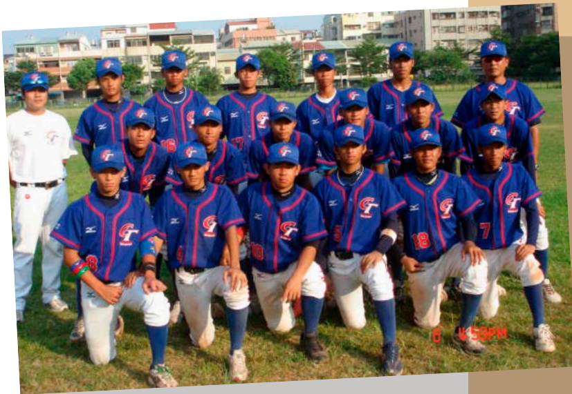
· 第十三屆IBA青少棒成員

因家境因素而轉往其他方面)，也可以設下綿密的保護網保護這些人才的棒球生命（例如要求教練不可過度使用）。