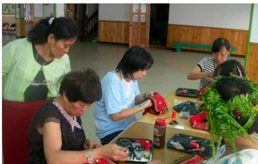
· 社區大學原住民專案課程