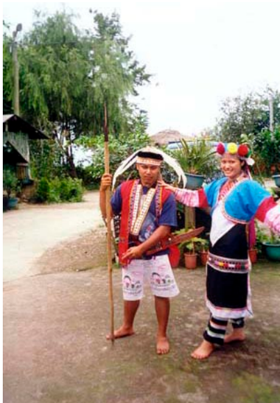
· 作者(右者)穿著代表其族群的傳統服飾攝於居處

當母 系社會的阿美族女子，與父權至上的泰雅族青年迸出愛的火花時，他們所孕育的下一代，是如何的在全然不同的文化背景下找到平衡點？