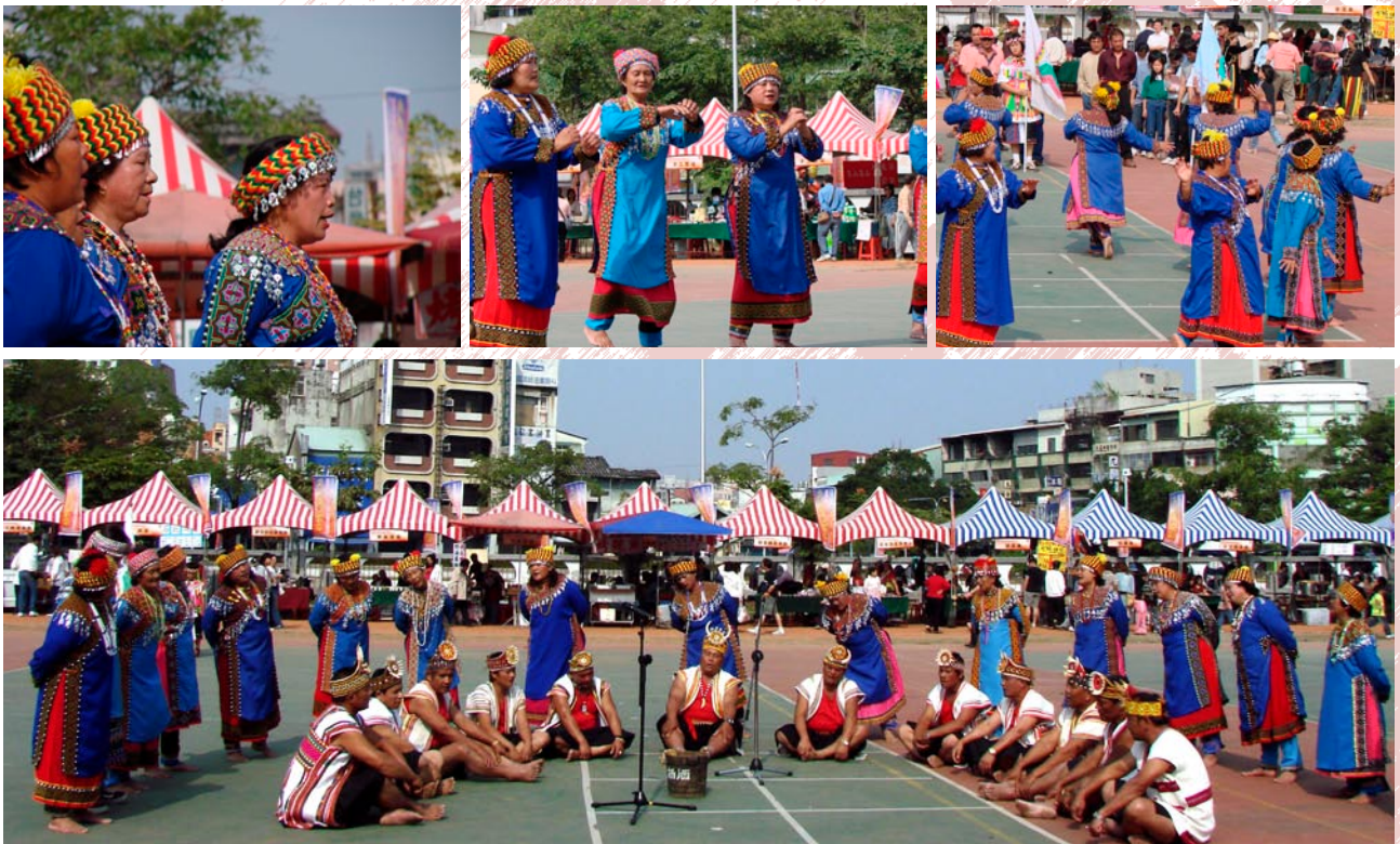
· 原住民在祭祀儀式中的吟唱與舞蹈

其實，我們這群孩子是代表著原住民族的族群大融合，我也很幸運的不斷用不同的觀點和角度來認識自己，在生活中面對與適應因多元文化而產生的衝突，進而學習到對其他文化族群的尊重，這是最寶貴的經驗。相對的，也承受兩個或三個以上族群文化傳承的責任，其實，身為原住民，不必有太多的壓力，而是要清楚的知道自己是誰。當我們認識了原住民文化，就等於認識了自己，用生活體驗真實的文化內涵，這就是真正的原住民。◀