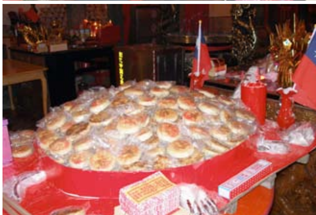
上圖/文化局門廳裝置極富年味的藝文人士團拜會場。 下圖/象徵祈求來年豐收滿溢之祭禮貢品。