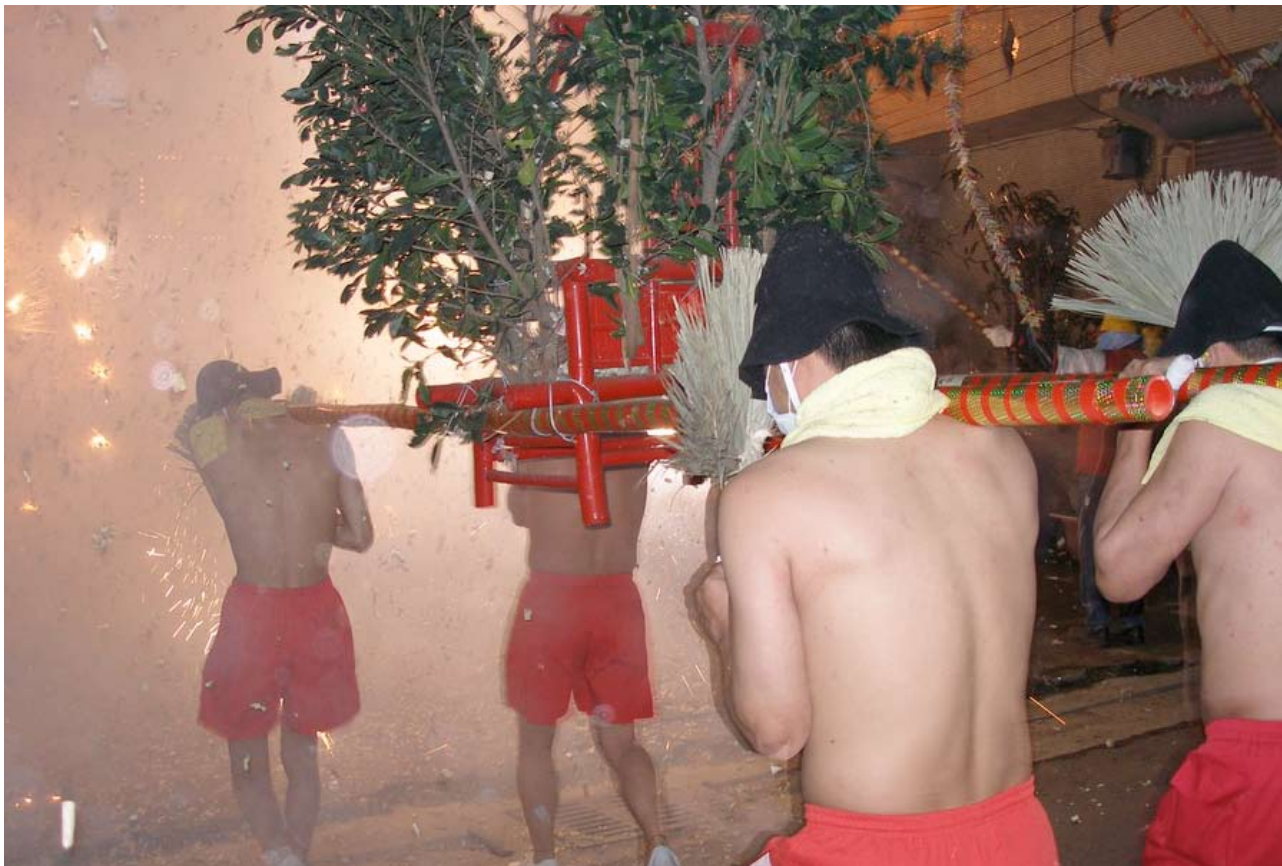
▲ 迎吉祥·炸福神/鬧元宵活動。

特色的節俗，讓每個人可以在不斷受挫的生命中，隨時都可能因為時序的變化，而對未來重新燃起全新的希望，如此一來，非但可以擺脫一層不變生活的苦悶，更可以適度激勵生命，奮力地往前衝刺。