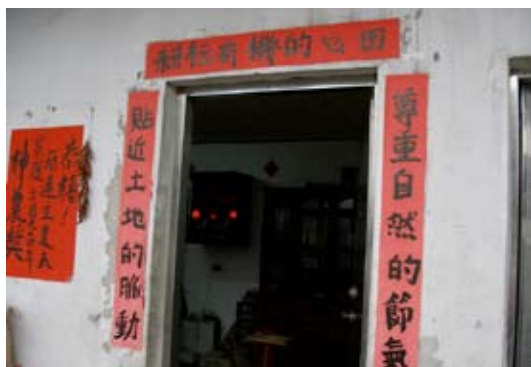
▲ 農村中表達敬重天地饒富童趣之春聯。