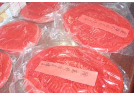
▲ 常見年節祭祀品-紅龜粿。