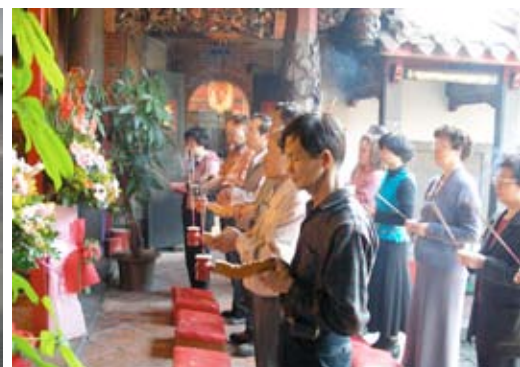
▲ 傳統祈福祭祀典禮。

正的含意，是新年期間不要碰這些不乾淨的東西，以免壞了一年的好運；也有人相信，過年期間白天不可午睡，相傳如此一來，整年度都會很懶惰，其中真正的含意有二：一是因為過年期間常有客人到家裡拜年，主人在睡午覺再匆忙爬起來，會讓人覺得很失禮；二是為了激勵人們，在一年的開始，更要積極奮發面對新的人生，不要以怠惰輕忽的態度，來渡過這一年。