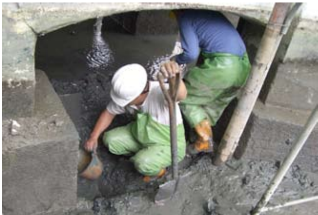
▲湖水抽乾後，挖掘埋於土中的拱磚基礎情形