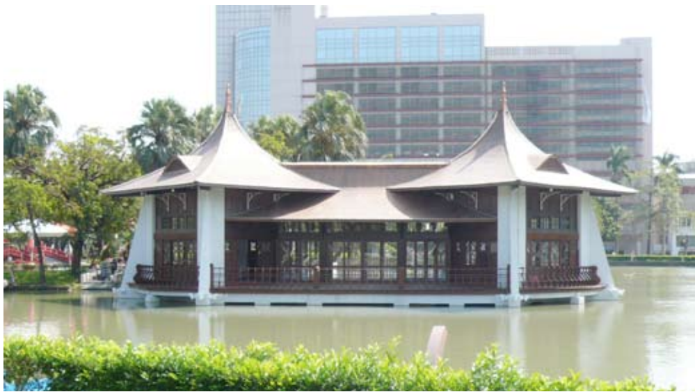
湖心亭公告為古蹟後修復完成之樣貌

1908年，為慶祝「台灣縱貫鐵路通車」在台中公園內舉行慶祝活動，同時也為歡迎前來主持典禮的日本閑院宮戴仁親王一也就是明治天皇的弟弟，特別設計興建了一座「休憩所」。這座休憩所就是今天大家所見到的「湖心亭」，當