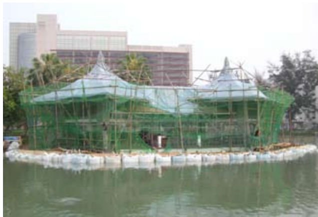
▲圍堰工程抽水施工情形

讓結構露明以利大家參觀，同時這樣作也有利於通風維護。由於它位在市中心區，常年來一直是是台中市市民共同的記憶及地理地標。