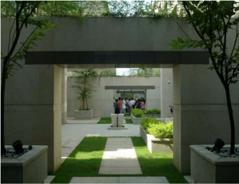
可駐足休憩的中庭空間

設開發業者贊助，將於97年1月25日至2月17日在新光三越百貨10樓文化廳舉行，其中包含聯展、專題演講、技術座談會及論壇等一系列活動。在聯展方面，包含國際知名日籍建築大師伊東豐雄以「聲音涵洞」為設計構想的台中大都會歌劇院，以及展現本市未來發展的輪廓的「臺中城市發展願景館」，另有代表台中最新潮流各式頂級名宅的「建築與生活館」。