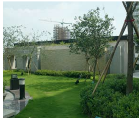
體驗日常生活一隅的美

藉由本次活動將台中城市美學與生活願景呈現予市民，並向市民宣告台中的城市美學與經濟發展，喚醒市民對於美學意識的自主性、自覺性及自發性，使美學融入現代社會日常生活中；更希望透過對美學的追求與實踐，喚起民衆的參與感、責任及義務，能落實在城市的每一個公共與私有的領域中，展現市民對城市、環境、生活及美學的重視與尊重，共同創造城市魅力與推展至國際城市舞台。不論是想知道世界建築思潮如何與台中城市空間對話，或一探台中名宅生活究竟，都歡迎您在歲末年初到新光三越百貨10樓文化館來共赴美學盛宴。