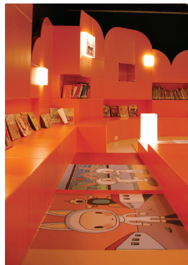
國立台灣美術館兒童繪本區

當家長的觀念培養、身體力行已水到渠成，就如同軟體條件已完備，那麼，好的硬體設施，如繪本館成立，則能提供更好的資源與環境。在向來注重文化層面的台中市，除文化局兒童室收藏繪本，