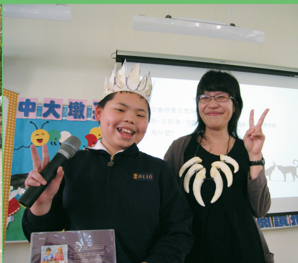
小朋友們競相提出對保存惠來遺址的想法，獲得作者讚許。