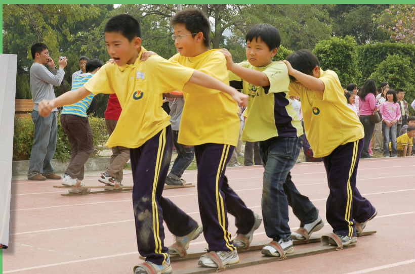
我們也來場陸上木屐大賽，一起叫醒穿山甲