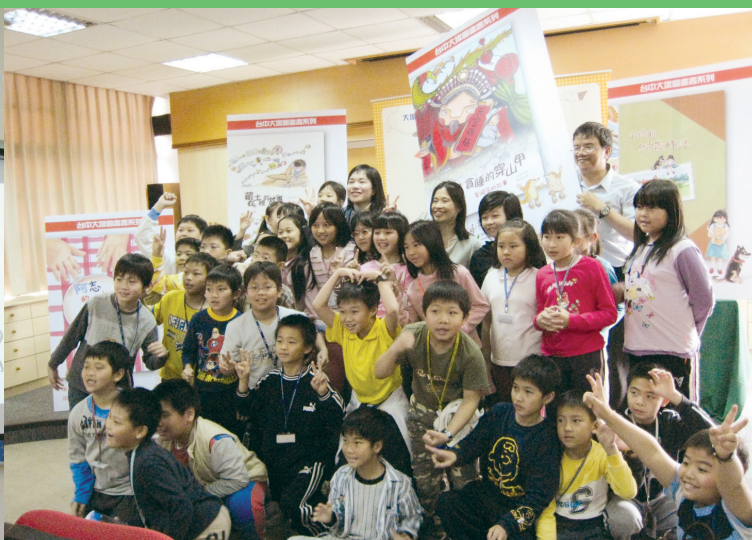
同學們開心的與作者（最後一排，左二）合影