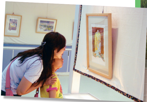
親子共賞大墩圖書的原畫