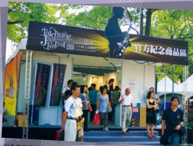
紀念商品區吸引樂迷消費珍藏

難忘的秋日爵士戀，年年於台中上演，今年的記憶仍然猶新，期待明年的台中爵士音樂節帶給我們更多的驚喜與滿載的回憶，讓我們開始倒數計時！