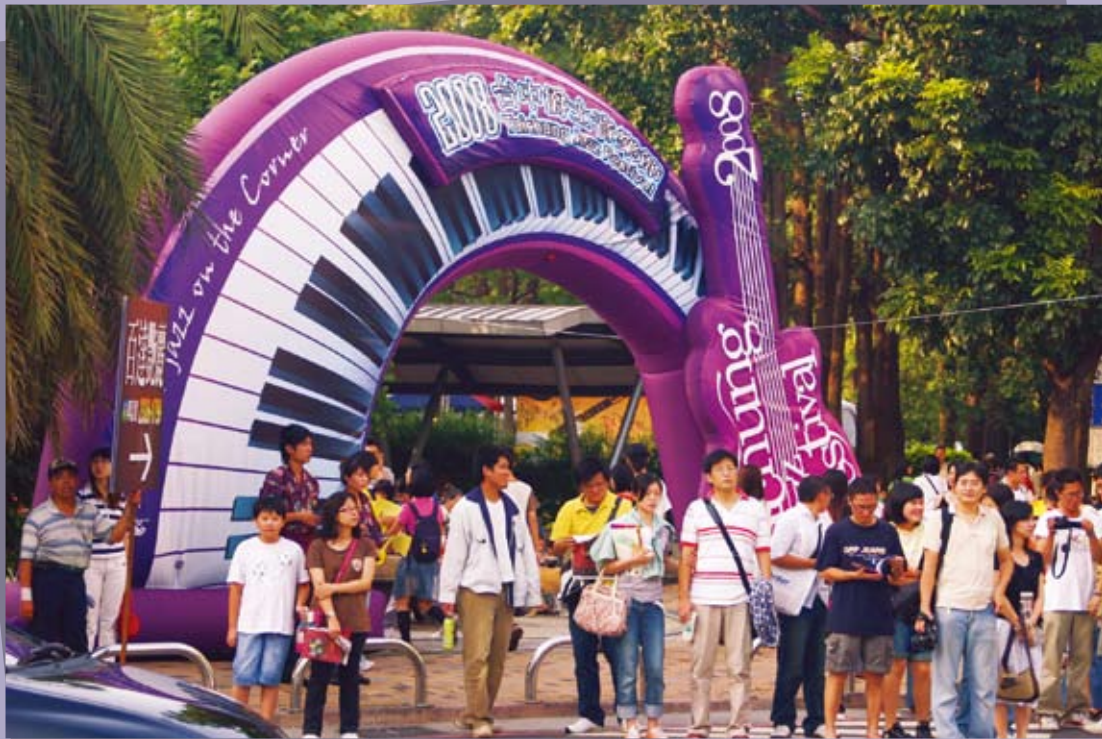
從南到北的樂迷紛紛聚集參與這場盛會

克杯、限量紀念明信片……等限量商品，一推出立即廣受好評，紛紛獲得爵士樂迷的珍藏，在整個活動現場可以隨處見到人人牛仔褲上別著專屬的限量紀念徽章、人人穿著紀念T恤穿梭於活動現場。