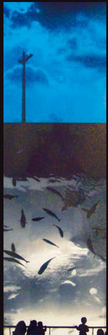
「線藝盎然—生態藝術展」之「失之永恆—地平線」自然與人為的對立

生態，是個不滅的議題；文化，是個永續的發展。在高度開發的現代社會中，生態已成為文化發展不可分割的一部分，文化溪流不斷流，生態維護也不停歇，這兩項與人類生活最切身，卻常常最不被視為第一優先的議題，在今年的彩繪城市系列活動上，慎重地結合了。這是一個正視文化多面向的開始，有更多更多的下一步需要人們的省思與行動，只要用心經營，文化的溪流永不枯竭！