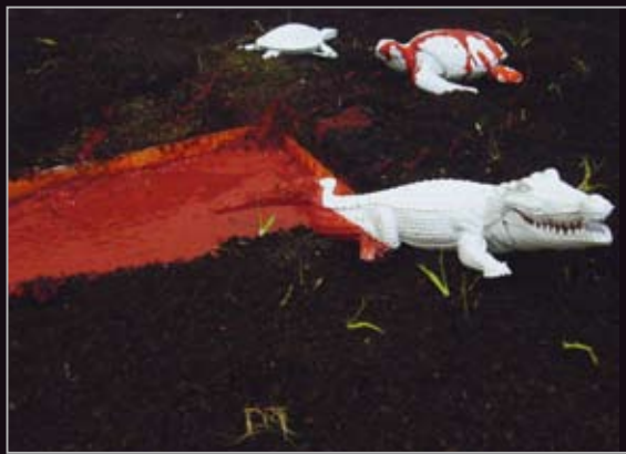
「綠藝盎然—生態藝術展」之「生·物·鏈」踴躍爬出血池

穿過彩墨叢林，拾級而上，迎面而來的，是更強烈的生態環保意識：綠藝盎然—生態藝術展。掀開「集體記憶」的門帘，撲鼻的揮發氣味，散亂的電視與隨機的影音，在營造出的壓縮時空裡創造集體記憶。踏出「集體記憶」的小空間，