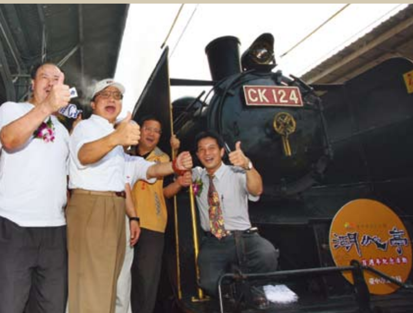
市長、議長與眾貴賓搭乘蒸氣火車抵達台中車站

創建於西元1908年位於台中公園的「湖心亭」，至2008年屆滿一百週年，台中市文化局於10月24日起一連三天舉辦一系列的「湖心亭」百週年紀念活動，讓這台中市的形象地標，再度成為全台民眾矚目的焦點。