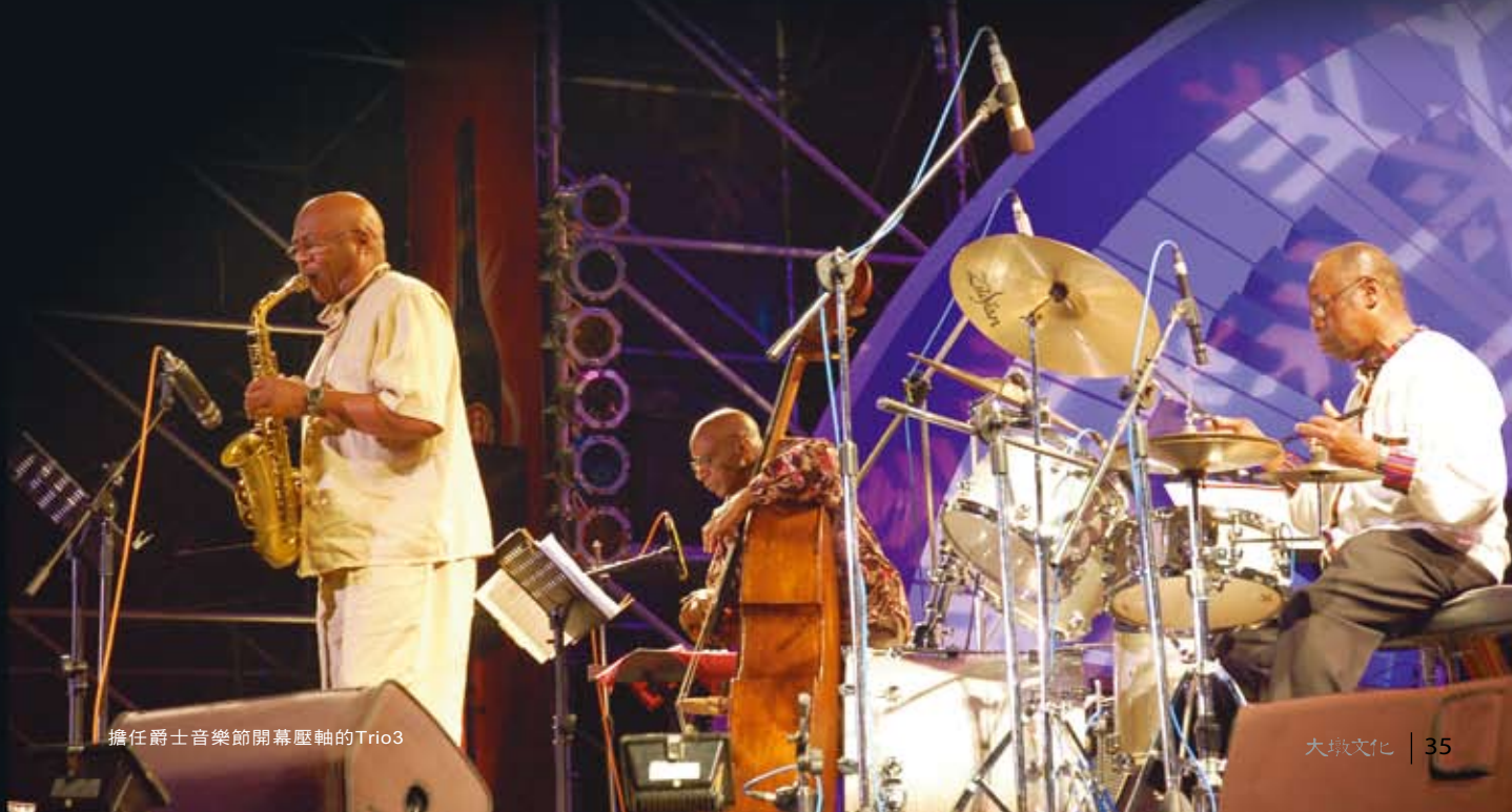
擔任爵士音樂節開幕壓軸的Trio3

有什麼活動可以讓人一來再來，一再期待，期待著來年還要再次參加？台中爵士音樂節就具有這種迷人的魅力！在主辦單位台中市文化局年年突破、年年創新舉辦之下，台中爵士音樂節不僅已成為國內年度音樂盛事，近幾年更大力延攬亞洲地區爵士樂團共襄盛舉，儼然已成為亞洲地區備受矚目的爵士音樂節活動，並且每年邀請國際級爵士大師進行免費戶外演出，更是讓爵士樂迷年年固定前來朝聖。