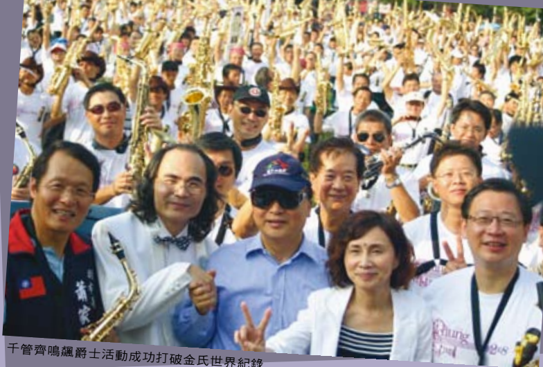
千管齊鳴颯爵士活動成功打破金氏世界紀錄

今年台中爵士音樂節邀請到的表演團體中，國外演出團體是歷年來最多的一次，而樂手的來頭更被爵士樂界公認為歷年之冠。