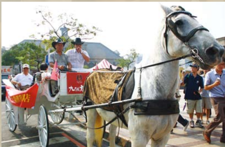
貴賓們乘坐馬車由奉迎門前往台中公園

一連三天的慶祝活動熱鬧圓滿地閉幕了，百年的湖心亭領受著歲月刻印，依然佇立於綠蔭參天的公園裡，當遊人漫步於老樹下，或憑欄倚望湖光水景，或於亭台角落偷閒半晌，湖心亭依將默默地為這城市守候著下一個百年。🍷