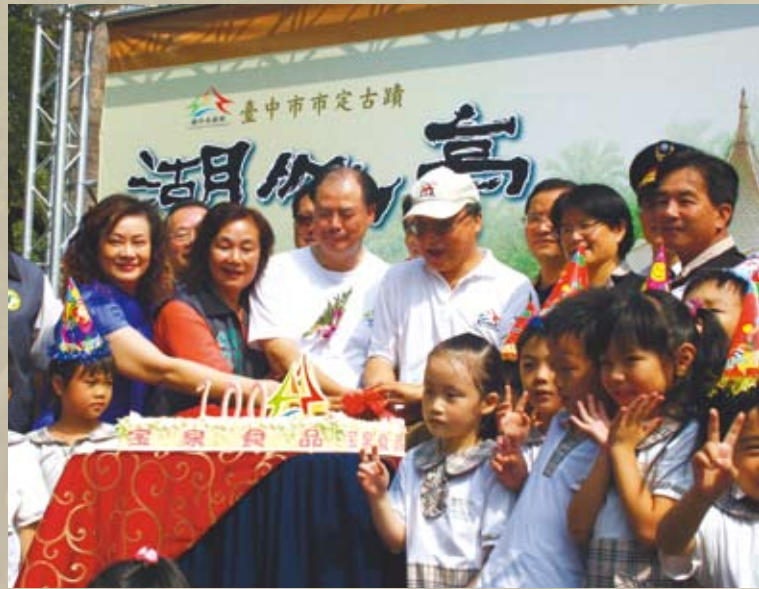
眾貴賓共同切生日蛋糕為湖心亭慶生

湖心亭的夜景映照著波光粼粼，加上絢麗的燈光秀，令人目不暇給。配合慶祝活動而搭設的大型水上舞台，讓晚間演唱會達到最高潮。首先由當紅偶像團體「黑girl」開場演出，緊接著多位歌手，強辯樂團、丁噹、品冠等人陸續登台演唱動聽的歌曲。值得一提的，強辯樂團主唱「黃牛」也是台中人，小時候常到台中公園遊玩，這次受邀演出，更是使出渾身解數，為湖心亭慶生會注入搖滾的青春活力。