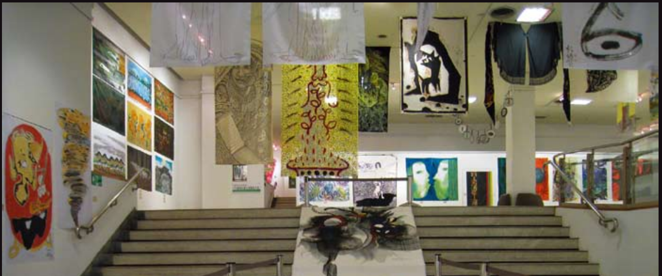
彷彿彩墨叢林一般的「2008國際彩墨生態藝術大展」

直接面對面的是一方黑土，形狀像一把利刃的血池，蹣跚爬行的生物，俯視血池的綠色小盒子，重複播放沒有生命的生態影像，看著鳥類生命史數位相片的模型鳥，泣訴不只是身為大自然物競天擇生物鏈一環的無奈，還有萬物之靈極盡貪婪的掠取。再轉頭，血跡斑斑動物圖像哀悼生態浩劫，自然與人為之間的平衡已不復在，惟「希望」仍留在潘朵拉的盒子裡。