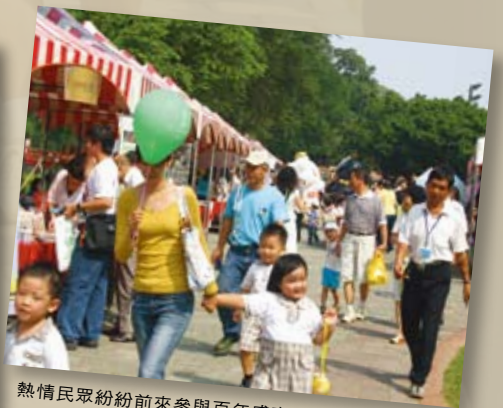
熱情民眾紛紛前來參與百年盛事