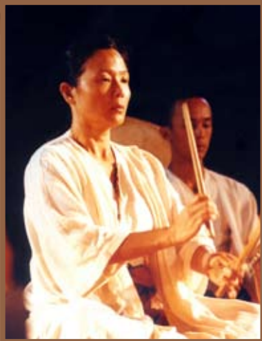
《空林山風：走路篇》劇照