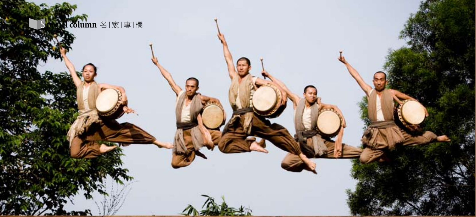
2008年《空林山風：走路篇》呈現出優人神鼓行腳台灣50天的心路歷程