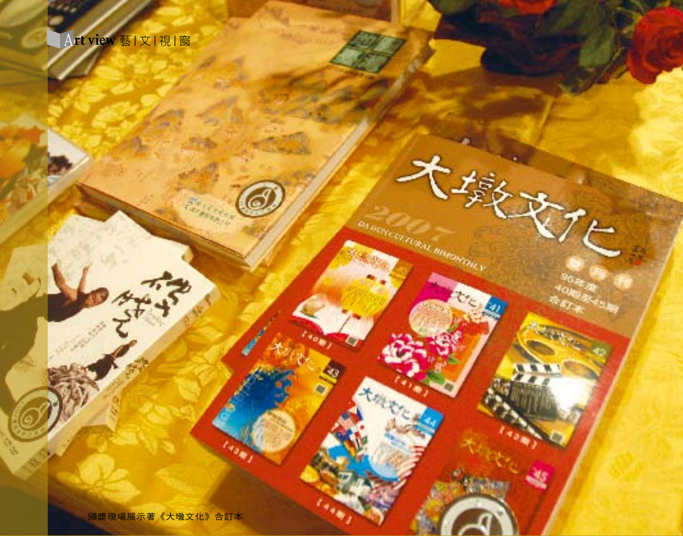
頒獎現場展示著《大墩文化》合訂本