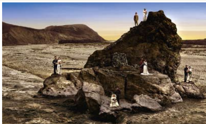
梅丁衍/好男石敢當

就此而論，藝術家作為社會基本的組成份子之一，他們透過藝術感性形式所呈現的關於「家」的探討，同時也反映了台灣社會在歷史發展過程中普遍的心理與精神縮影。