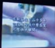
吳瑪琍/新莊女人的故事