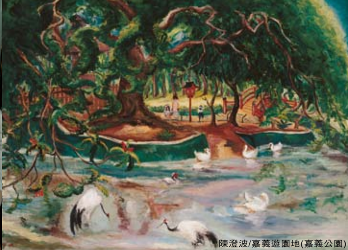
陳澄波/嘉義遊園地(嘉義公園)