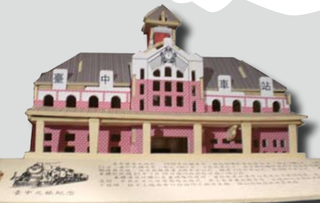
台中火車站建築明信片

若提到101大樓，人們會聯想到台北市；說到高雄港與愛河，則是高雄市的象徵；那麼，提到台中市，什麼圖像會浮現在人們腦海？是佇立台中公園已達百年的「湖心亭」，或是東海大學裡的「路思義教堂」，抑或是同樣具有百年歷史的二級古蹟「台中火車站」等……。