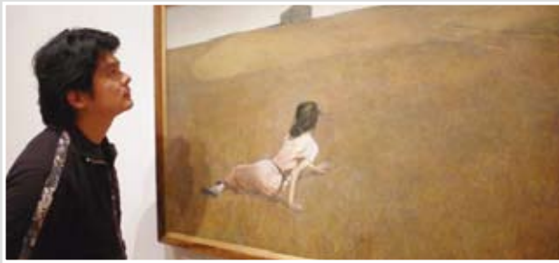
在紐約現代藝術博物館親睹魏斯名作〈克莉斯汀娜的世界〉