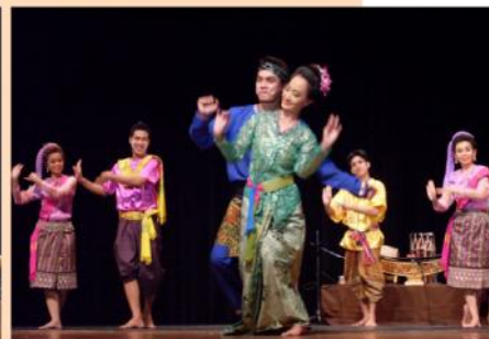
▲ 泰國舞者優雅精緻的演出，帶領觀眾經歷了豐盛的文化之旅。