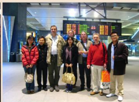
▲ 捷克愛樂團員搭高鐵訪台中，對文化城留下深刻印象。

從小對捷克的印象就是來自於黑膠唱片上面的美妙音符，接觸到史梅塔納、德弗乍克、楊納傑克、蘇克等捷克音樂家的偉大藝術後，更漸漸地進而激發對捷克這個國家文化的研究興趣。