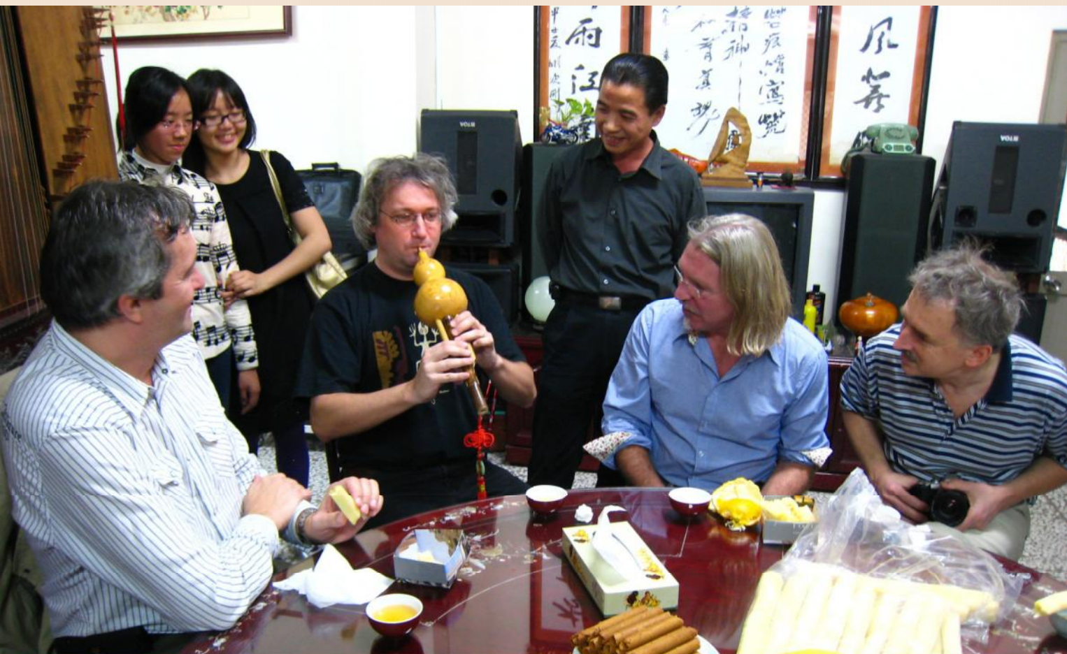
▲ 洋溢茶香與樂音的異國文化交流。