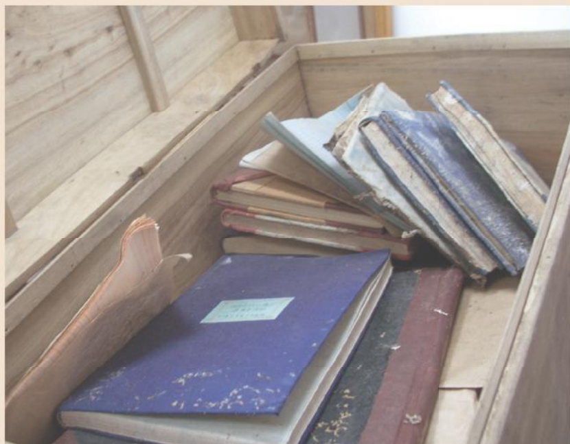
▲ 江西省的文物就放置在這樣的木箱中。

戰火下倖存的史蹟在歲月推移中再見天日，泛黃蟲蛀的紙頁夾帶著倉皇逃亂的斑斑淚痕；當年是誰護送這批文件一路南撤？這些文件有什麼重要性需要千里迢迢南遷？來台中市後如何找存放的地點？從本期起，將分四期介紹這些文物來台的歷程與背後的故事。