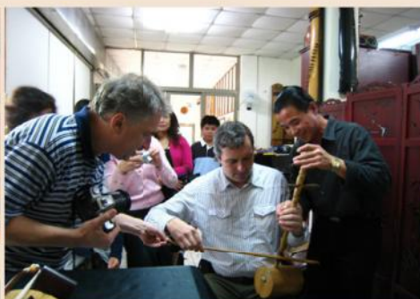
▲ 愛樂團員們興致高昂地學習如何拉奏胡琴。