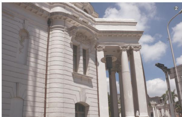
1 2 台中市役所是目前台中市保留最完整的巴洛克建築之一。

相信 許多人一定知道台中州廳（今台中市政府）與台中市役所，是台中市相當具代表性的巴洛克建築，本文將帶領您一同循著台中市的巴洛克軌跡，介紹這些建築背後的故事與特色，挖掘隱藏在華麗背後的複雜情結。