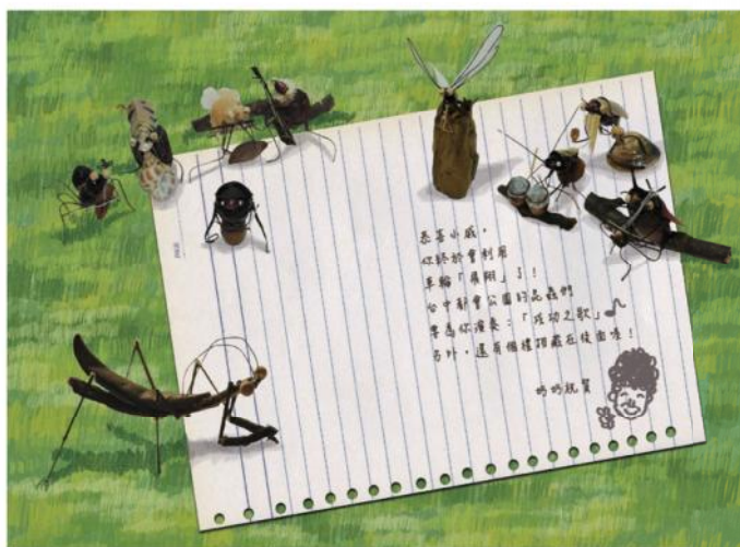
書裡出現了實際用枯葉、果子作成的昆蟲，相當特別。（文/宋佩）

質，這也是每個小孩生命中不可或缺的成长養分。」於是，決定擷取她童年與少女求學的階段成為故事基底，呈現她生命中所彰顯的珍貴人格特質。