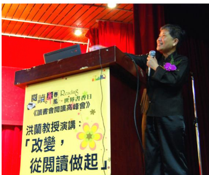
◎ 洪蘭老師的演講「改變，從閱讀做起」。

閱讀是很個人化的行為，閱讀的方式、環境與書目選擇等等，透露出一個人的人格特質與環境背景；閱讀也可以很大眾化，透過群體力量感染興味引發閱讀潮流。在推廣閱讀活動時，名人現身說法往往最能引起民衆的興趣，因此壓軸活動規劃了「名家閱讀講座」，邀請知名作家鍾文音、廖玉蕙和讀者聊閱讀地圖、文學與生活等如何將閱讀融入生活的私房見解。4月26日作家鍾文音分享她的寫作地景與閱讀地圖，吸引了衆多書迷與對文學、閱讀等相關議題感興趣的市民前往聆聽，深刻地參與了