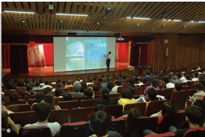
⑤⑥ 2008年建築文化篇研討會剖析台中的過去與未來的建築藍圖，引起極大迴響。

從歷史建築、古蹟文化、公共建設、城市生活美學、生態及景觀建築、房地產的前景及未來等進行為期二天的深度探討，共計發表了18篇論文、2場主題式演講及6場研討，為台中市建築文化留下了珍貴的資料，也開啓了民衆對自身所處的環境有更深一層的了解，並展望台中建構成為多元精彩的國際大城。