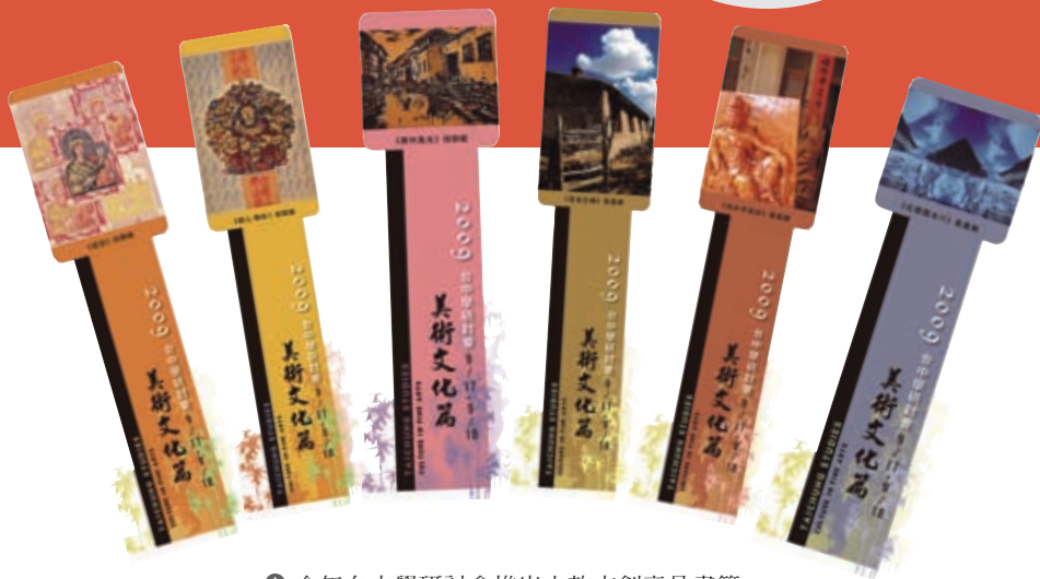
今年台中學研討會推出六款文創產品書籤。

活動的主導權，逐漸從戰後、戒嚴前的極度開放走向中央極權。在一個政權根基不穩的年代，政治上統治者的合法性需要依賴文化正統來加強，而美術界也在同時期上演著法統捍衛戰，並從媒材、技法、題材，一路延燒到美學主張，衍生出種種思想上的鬥爭。歷經1960年代推崇歐美現代主義的集團認同感，至70年代批判反省聲浪四起，文化界開始轉為對台灣社會、本土文化的關懷。在70與80年代之間，