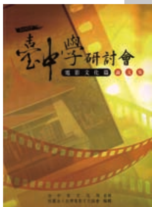
▲歷年台中學研討會論文集。