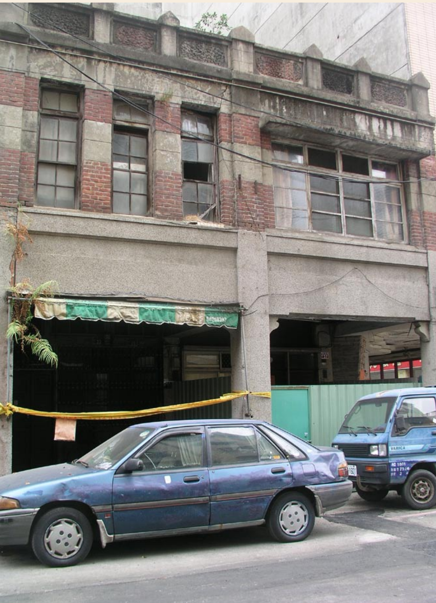
▲江西省政府撤退到台中市時所購買的臨時辦公處，迄今仍然保存完整。

後20天左右，贛州即被中共劉伯承率領的軍隊攻佔，江西省政府再度南遷到會昌，而江西省銀行則在1949年10月25日公告將輔幣券回收。