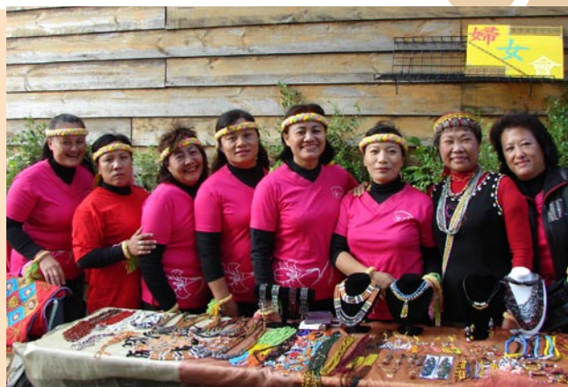
▲擁有一群好伙伴，支持他開拓出一片天。

目染之下就學會了。」她從第一件先生的衣服做起，開始發揮天賦，用一雙巧手漸漸地揮灑出自己的一片天空。