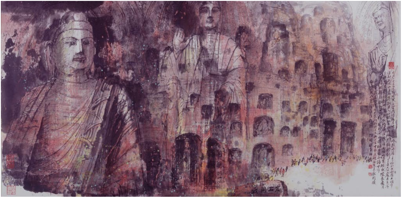
▲ 雲岡石窟 68x136cm 2006