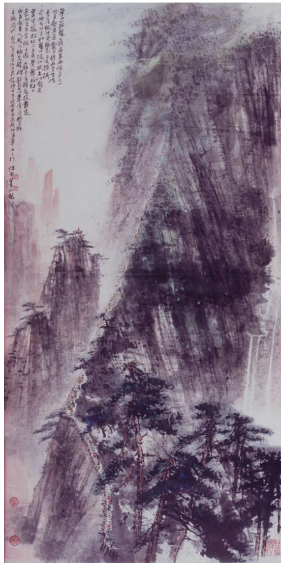
● 華山蒼龍嶺 68.5x136cm 2006