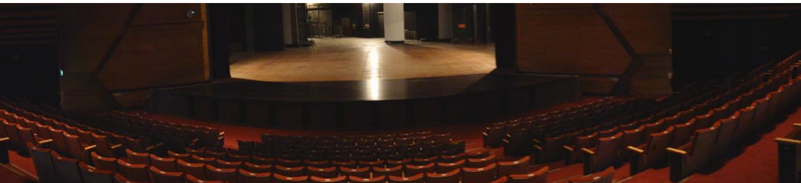
中山堂升降樂池設備更新，提供樂隊安全舒適的演出空間。

兒童館戶外劇場及館舍修繕工程」補助案，將兒童館後門花台改建為戶外表演場所，從去年9月著手規劃設計，並已於今年7月完工，因此除了館內演藝廳外，亦能於戶外開放空間辦理藝文表演活動，