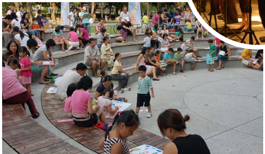
歡樂劇場不僅可以是表演場所，亦是社區居民的休閒據點。