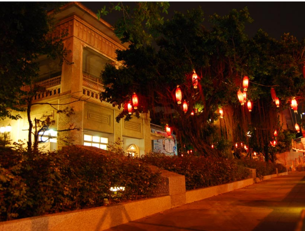
▲ 市長公館前的公有角地轉型為開放空間。