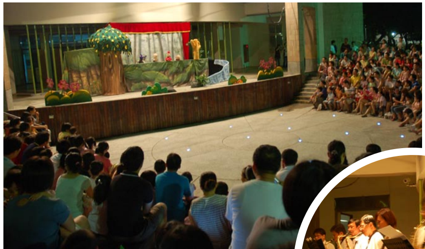
兒童館歡樂劇場首演邀請到小青蛙劇團表演。

這座可容納250人左右的歡樂劇場，在日後亦將規劃更多精采的演藝活動以饗市民，並歡迎向文化局洽詢借用該場地辦理藝文活動。