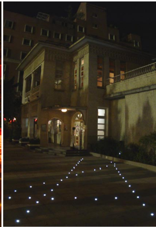
▼ ▲ 市長公館經由重新規劃，整個煥然一新。

幾個月前，為了配合雙十文化流域整體規劃，市長公館的圍牆被拆除，位於建築物邊界、原本屬於庭院範圍的公有角地，轉型為開放式空間，重新鋪設人行空間鋪面，種植綠意盎然的植栽，也增設了街道傢俱、地面埋藏導引燈源等，讓有八十年歷史的市長公館以更親和的姿態，展現於逛街行人的眼前，不僅如此，這片角地更與其它周邊文化據點共同串連，建立起公共空間架構系統，塑造雙十路之文化散步空間。