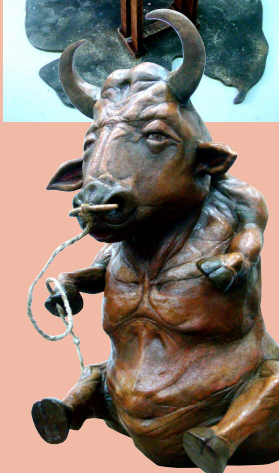
▲充滿黑色幽默的〈物·體互換〉系列，以動物反諷人的世界。