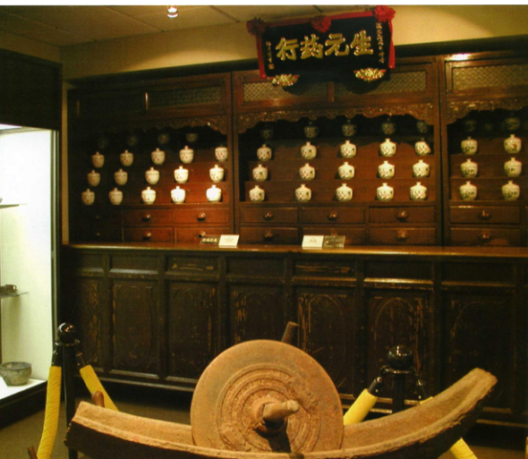
此檜木藥櫃是迪化街一家老藥舖所贈送。傳統的中藥櫃每個抽屜內有十二小格放不同藥材，瓷碗用來存放易潮溼或珍貴藥材。