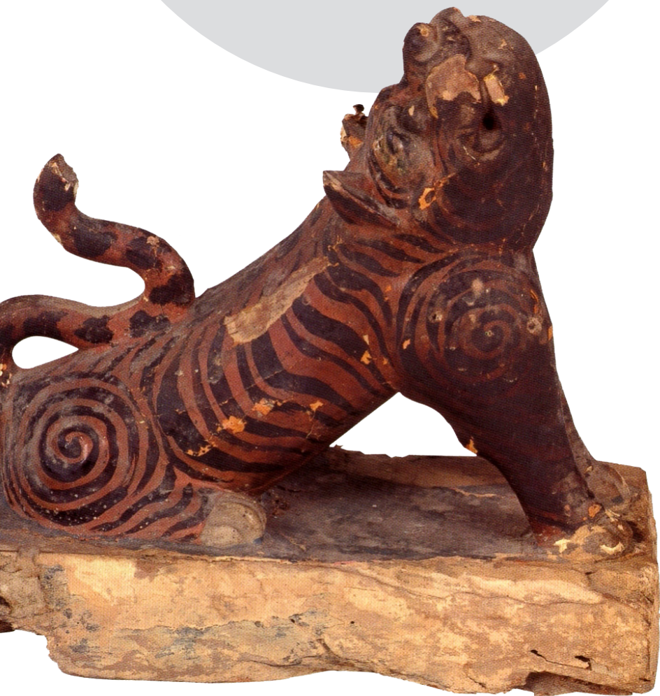
▲虎爺通常供奉在神桌底下，有驅逐惡魔及鎮護廟宇的功能，同時也是小孩子的守護神。