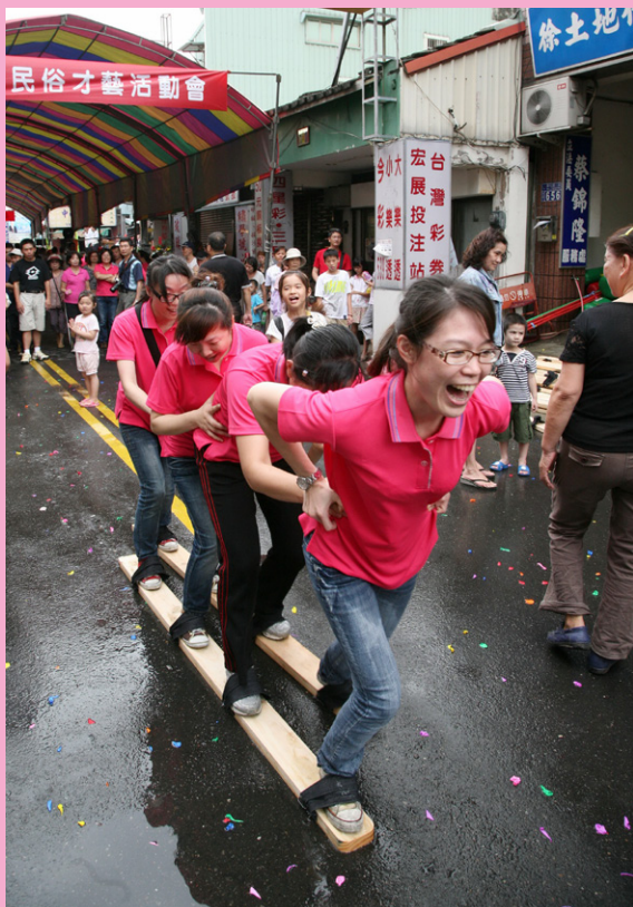
▲活動當天民眾熱情參與穿木屐踩街遊戲。

全國 獨一無二的台中市南屯老街（舊稱犁頭店街）端午節民俗活動——「穿木屐 躡鮫鯉」已流傳了很多年，這個在地自發性的活動，是南屯老街