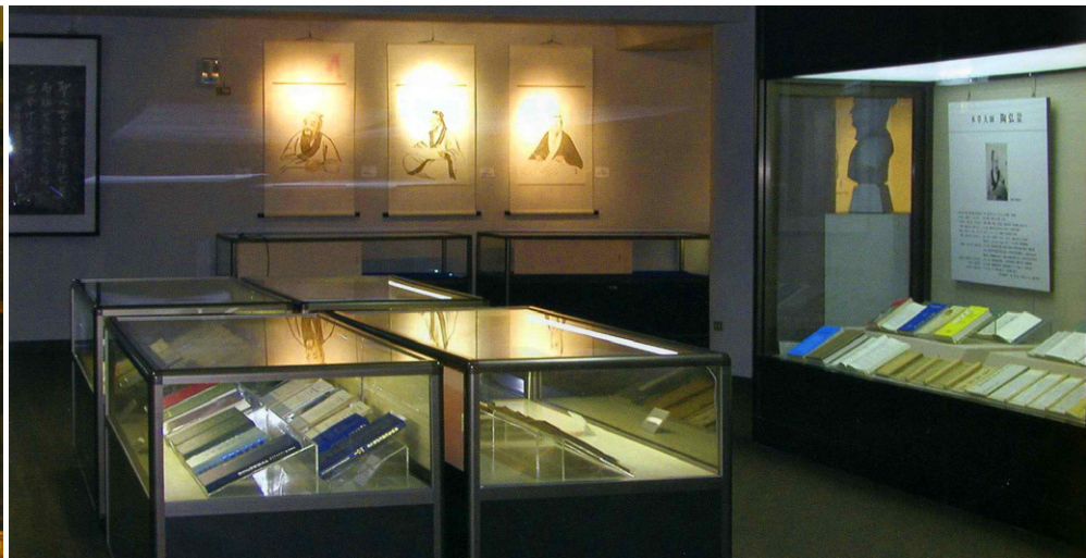
館內展品蒐集不易、件件珍貴，走一趟等於看完一部中醫醫學史。