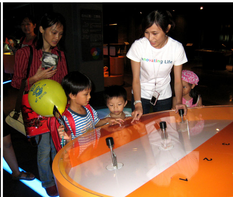
△大小朋友可在「達達的魔術世界」體驗光電互動的探索之旅。