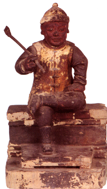
▲日治時期的著名盜賊廖添丁，是民間故事中的抗日傳奇人物，成為供人膜拜的對象。

台中市有文化城的美譽，其原因就在於市政建設上一向相當重視文化的保存與推廣。早在民國65年即成立當時全台灣第一座文化中心——文英館，並依專家學者的建議，著手收集台灣傳統民俗文物，堪稱為台灣各縣市政府關注本土文物較早的案例，且由於起步較早、收藏量豐，當中不乏現已消逝的珍貴古物，價值甚鉅。