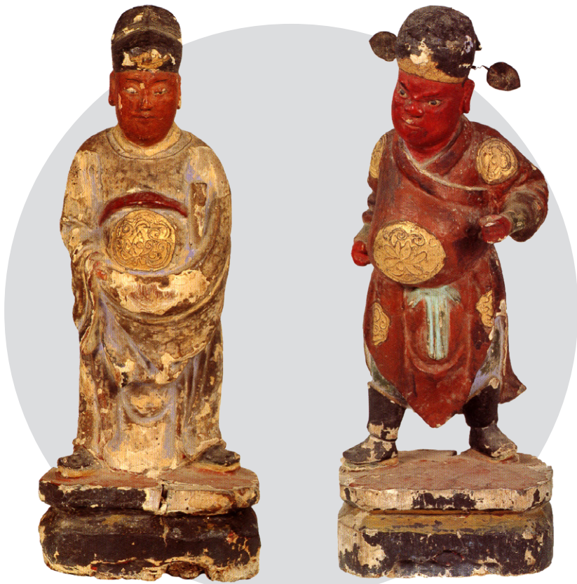
▲文武判官可見於土地廟中，分列土地公兩側，幫土地公分憂解勞。