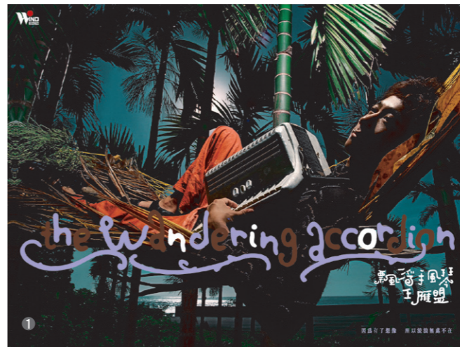
1 《飄浮手風琴》專輯/ 2005年入圍葛萊美獎最佳唱片包裝設計獎