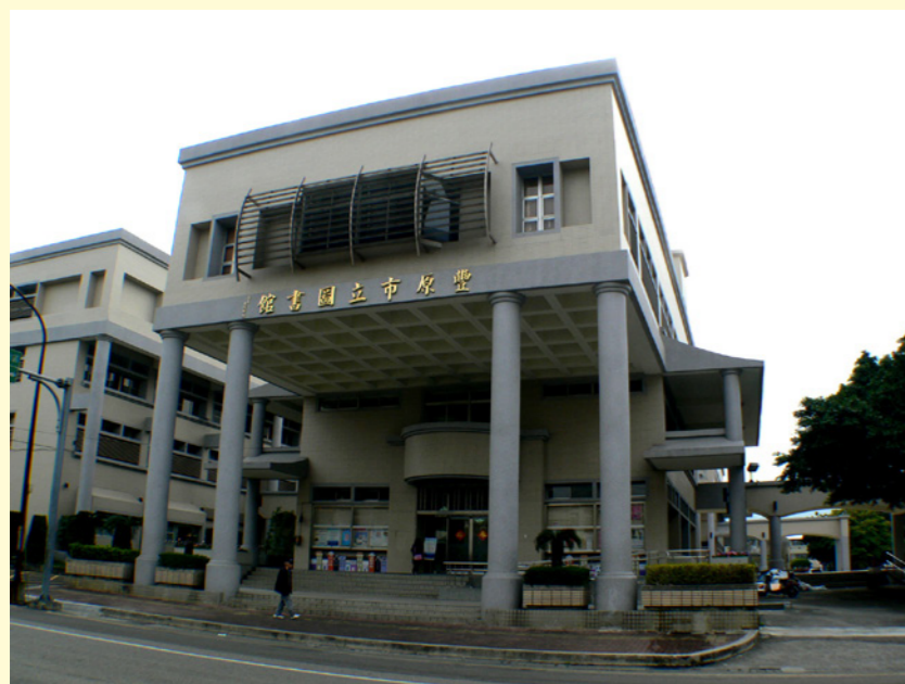
▲豐原區圖書館兩大館之一的「兒少館」，原為豐原市立圖書館。