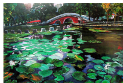
▲ 綠意綿延 / 簡嘉助 / 水彩 / 對開