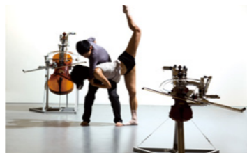
▲黃翊《交響樂計畫》劇照。