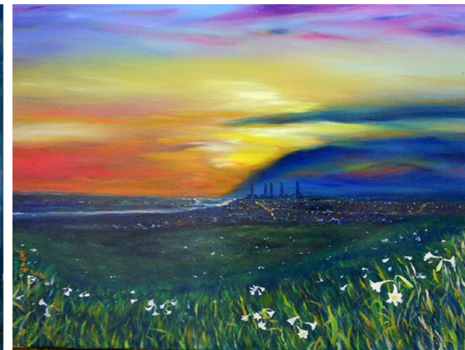
▲秘密花園 / 陳惠芬 / 油畫 / 20F

臺灣受到多元文化的影響，藝術的表現技法、媒材、內容皆不斷的創新與突破。臺中縣藝術家學會集結不同領域的藝術家，共同攜手創作與學習，藉由各型各樣的素材來發揮所長，融入對生命的體會與熱愛，反應客觀世界的審美觀，畫