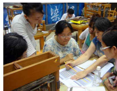
▲ 泰雅梭織技藝班的老師與學員們分析討論織紋。