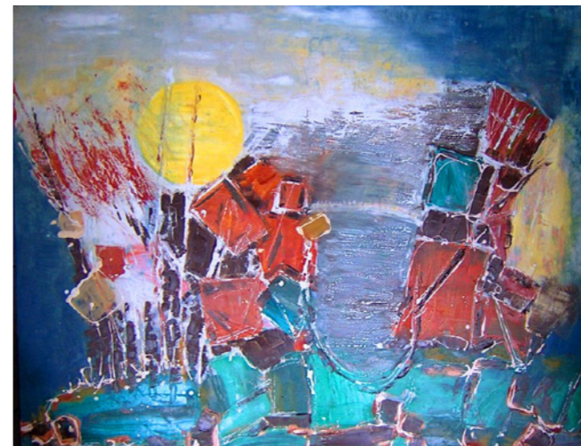
▲鯉魚潭日落 / 陳滋祥 / 油畫 / 50F