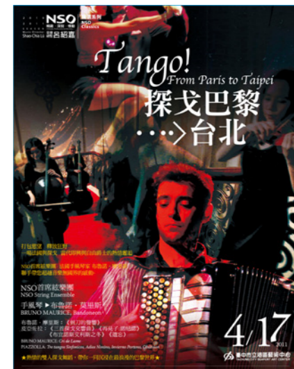
▲國家交響樂團首席絃樂團將與法國手風琴大師攜手演出。

時間：4月17日（星期日）14：30 地點：港區藝術中心演藝廳 購票請洽國家交響樂團 02-33939623 或兩廳院售票系統 www.artsticket.com.tw