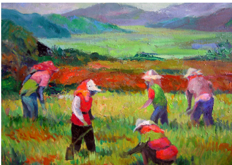
◎大肚山上的農婦 / 蔡景星 / 油畫 / 12F