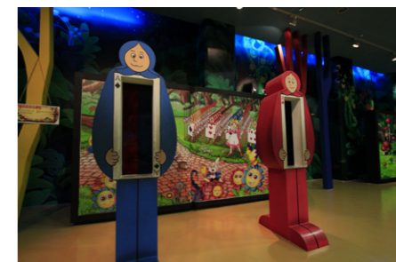
◀大里兒童藝術館歡迎所有喜愛藝術的大小朋友前來一遊。