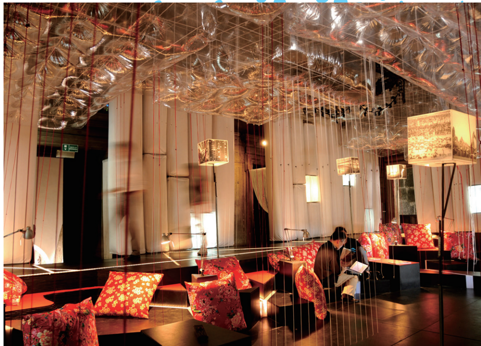
● 第十二屆「威尼斯國際藝術展」臺灣館展場一景。

與論述，為臺灣挑選出更多優秀的建築團隊參展。2006年臺灣館由策展人阮慶岳教授以《微型城市》(Micro Cities)為題目，邀請劉國滄、黃聲遠、謝英俊和來自荷蘭的Marco Casagrande，以及來自挪威的3RW Architects建築團體共同參展；2008年呂理煌教授領軍的「建築繁殖場」榮獲威尼斯大