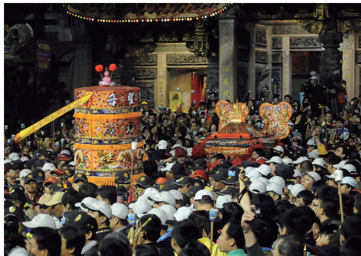
▲大甲媽祖進香起駕時鎮瀾宮前的盛況。由於前來致意的陣頭不斷，加上數萬名信徒前來送駕，媽祖神轎往往在廣場裡停留一段時間，顯示信徒的熱誠和大甲媽祖受到的歡迎。