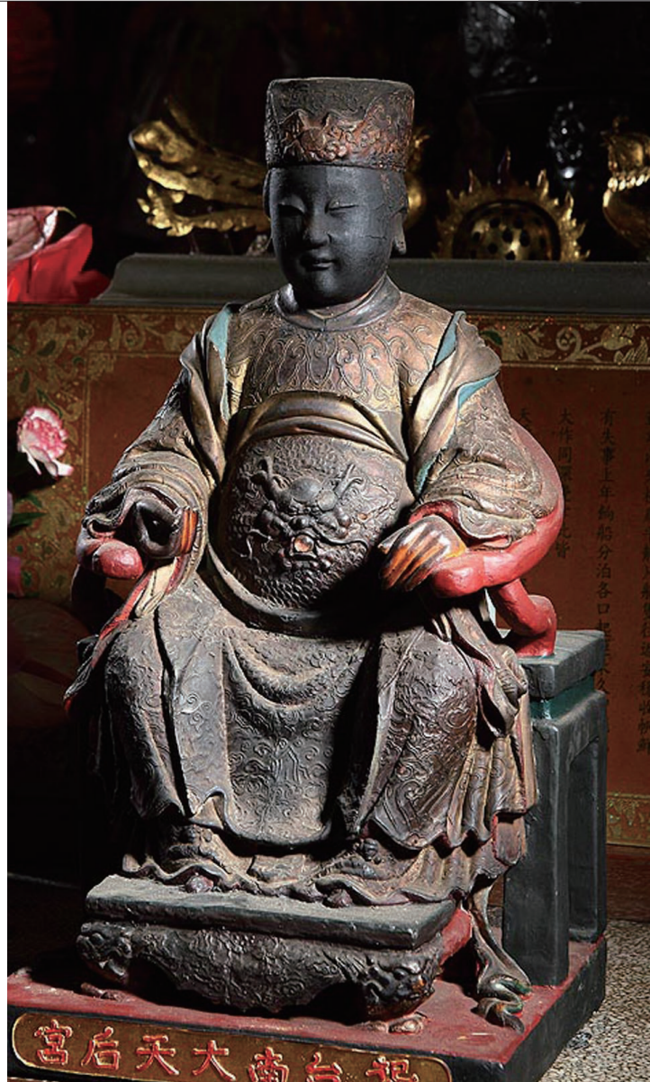
▲臺南大天后宮木雕媽祖神像。

媽祖，是臺灣民間信仰中主要的神祇之一，源起於中國大陸宋朝時期。媽祖也被稱為天妃、天后