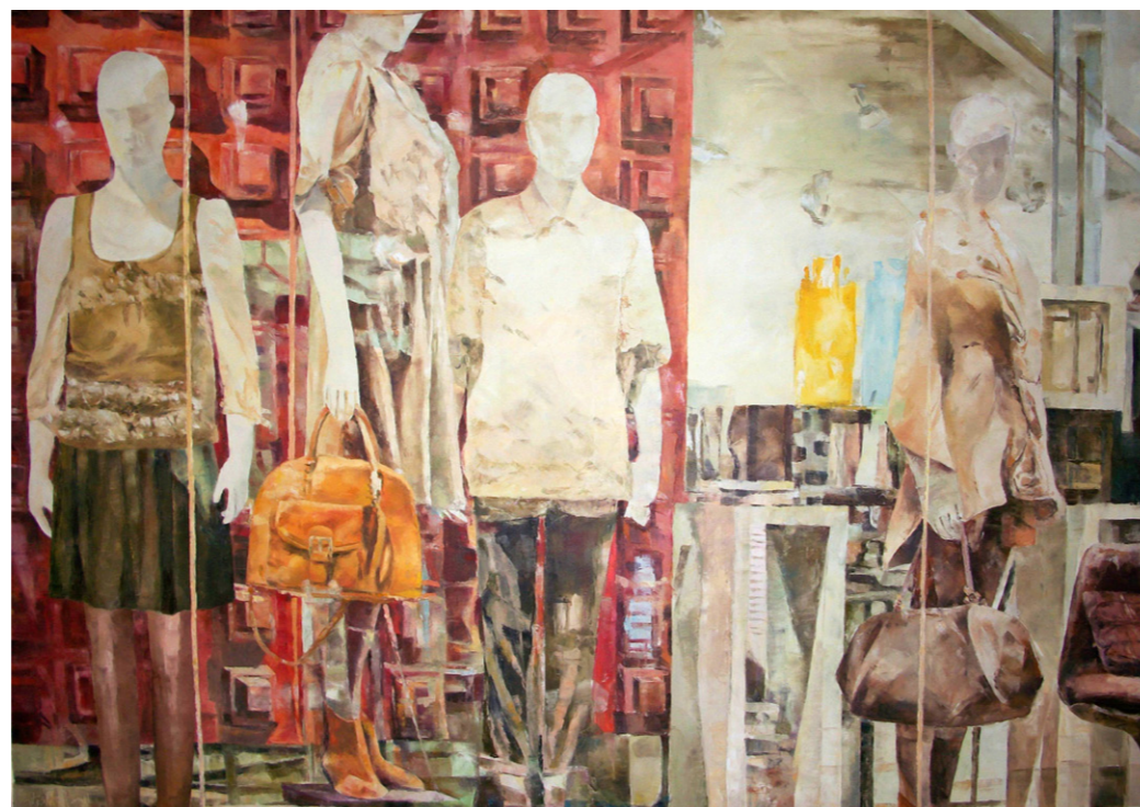
徵件第二名陳瑞瑚 / 時尚空間 / 2011/112x162cm

今年大展公開徵件共有118位送件參賽，由於徵件作品都很優秀，無形中增加了評選的難度。第