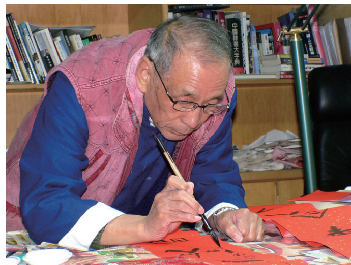
姜一涵揮毫的專注神情。

眼尖的民衆應該都發現了，自今年3月起，每期《文化臺中》邀請不同的優秀書法家為封面刊名題字，由德高望重的姜一涵教授起頭，接著是陳炫明老師、程代勒教授，這三位書法名家的筆墨各有特色，他們的人生也同樣精彩。