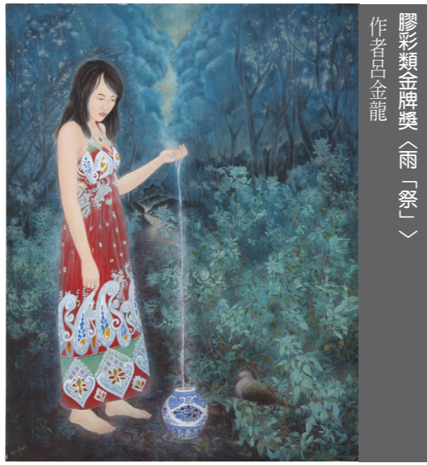
膠彩類金牌獎〈雨「祭」〉 作者白金龍