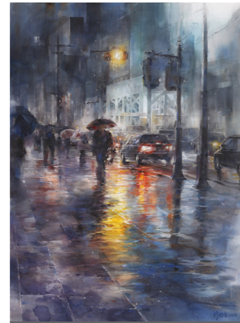
水彩類金牌獎〈城市雨調〉 作者林經哲