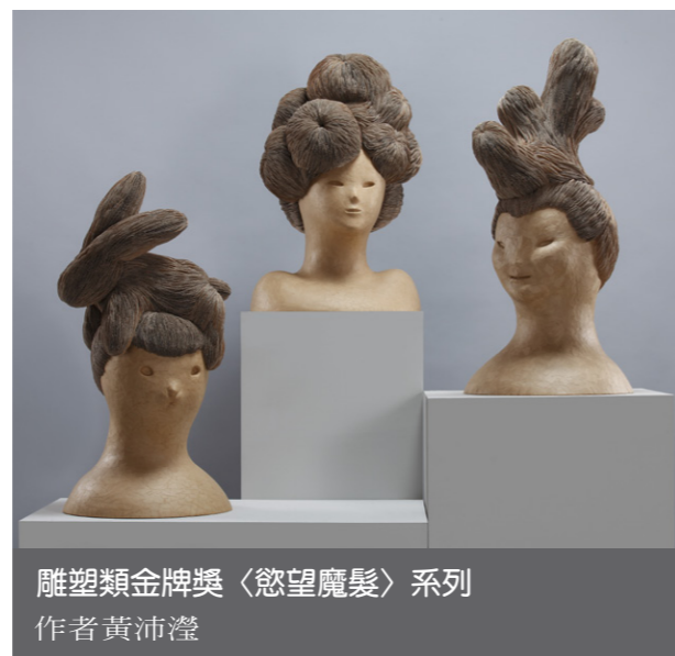
雕塑類金牌獎〈欲望魔髮〉系列 作者黃沛澄

主辦、國立藝術教育館承辦的「全國美展」，也從1929年起共辦理了十七屆（前三屆於上海、南京及重慶舉辦，第四屆於臺灣復辦），至2007年教育部正式廢止「全國美術展覽會舉行辦法」後停辦。歷經八十多年的演變，上述公辦美展雖因時空更迭以及更換承辦單位等因素而停辦，但終於在今年由國美館整合規劃推出100年「全國美術展」，此項展覽之後預計每年舉辦一次，臺灣美術環境將可隨著時代的演變而多元開放，公辦美展亦將持續扮演引領臺灣美術發展的時代性角色。