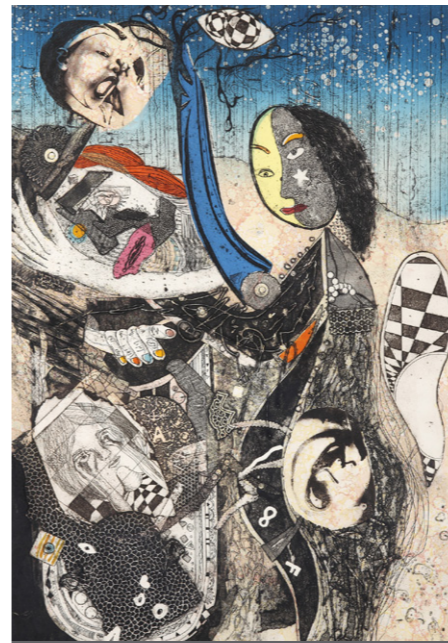
版畫類金牌獎〈唯一〉 作者陳御辰