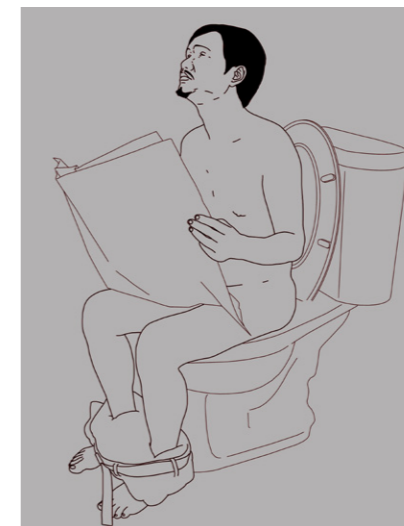
新媒體藝術類金牌獎 〈常日小短劇〉 作者許哲瑜