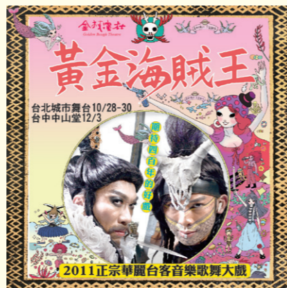
▲ 金枝演社《黃金海賊王》