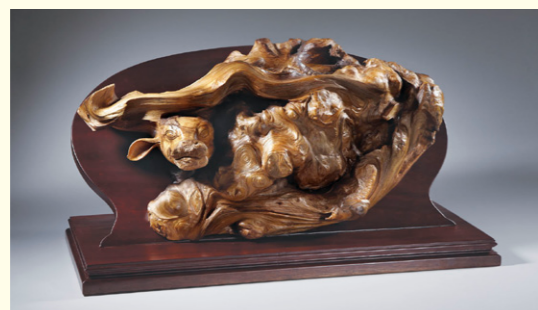
▲ 2009/牛 / 第7屆工藝師施惠閔。

工藝美術、創作和生活息息相關，工藝作品不僅傳達創作者獨特的意象思維，還能透過不同的角度與擺設、觀賞與使用，在生活中創造更多聯想空間。