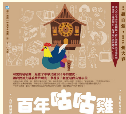
▲ 如果兒童劇團《百年咕咕雞》