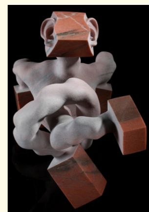
▲ 蛆 蛹 /106/40x34x26cm / 粉紅大理石 / Marble/2008

王國憲留學義大利，其作品風格受西方影響，抽象而富趣味。近年來他以石材浮雕進行創作，運用創新的噴砂手法，讓石材的色澤散發出強烈的黑白對比，並結合現代及古樸的藝術感，呈現出多元的幾何圖形。王國憲也曾在作品中，嘗試將當下的雕塑藝術環境放入造形研究的當代性中，以石材創作來詮釋。曾連續三年獲全省美展前三名，並且榮獲「永久免審查」之殊榮。作品成績更是傲人，曾獲北美館「禮運大同篇」石雕、花蓮文化中心公共藝術、萬華車站公共藝術徵件首獎。此展將可讓中部民眾一睹王國憲宏觀的雕塑世界。