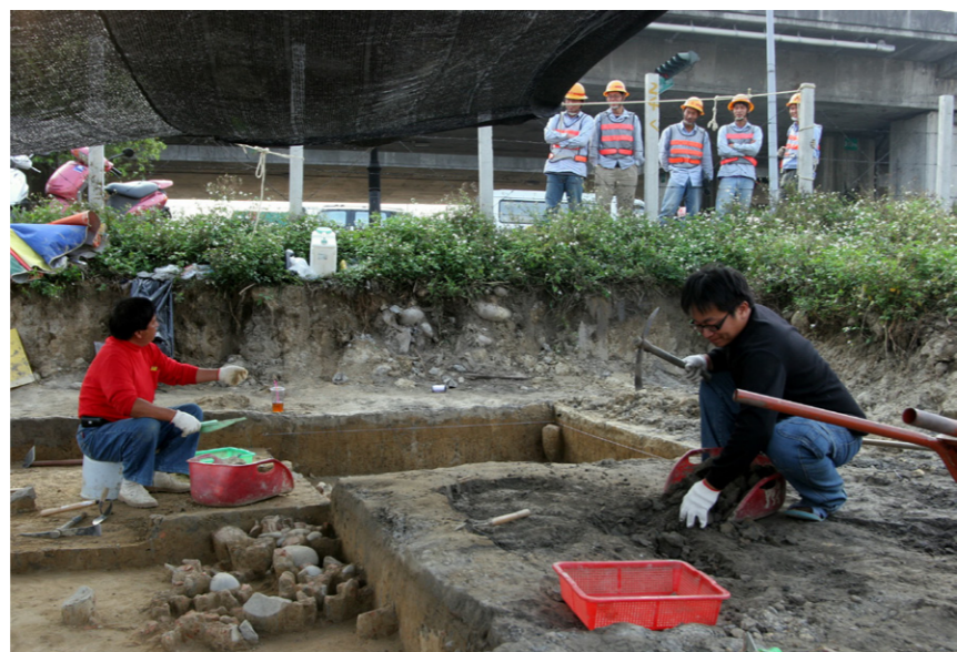
▲ 城市考古極易吸引民眾的好奇。

西屯 原名西大墩，所謂「墩」是指高而突出之地。據荷蘭時期的紀錄，臺中市的聚落最早在1640年即有平埔族的「貓霧揀社」，而漢人的拓墾則追溯到1710年清康熙年間張國的拓墾。在行政區的劃分上，嘉慶15年（1810年）時清朝政府首次在臺灣中部設立「臺灣縣」，至日治時期改設臺中州，「臺中」之名因此確立。大正9年（1920年）將西大墩區改稱「西屯庄」，西屯之名自此開始。