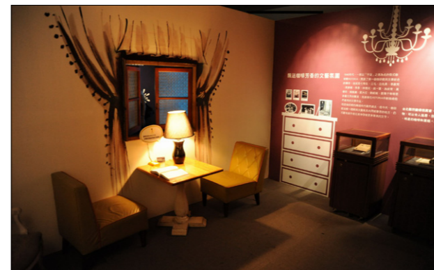
▲ 展場以各式主題，呈現孕育出臺灣文學文化歷史的場景與潛在的力量。